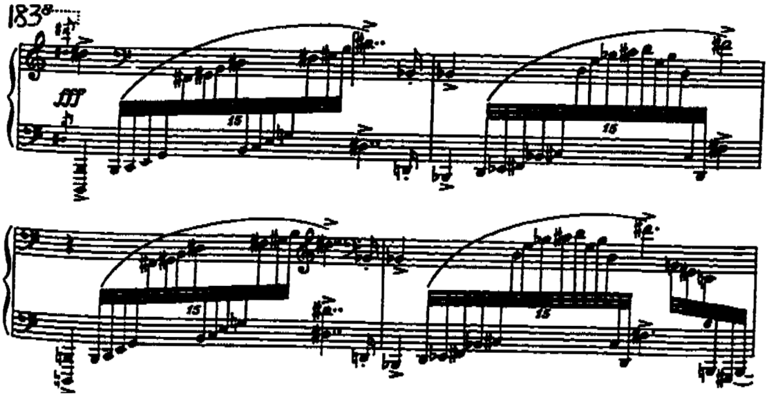
Şema 3.2: 183. ölçüde yapılan zirve

Yeniden sergi, ilk temayla başlar, fakat bu sefer temanın ABCA yapısı ABC olarak kısaltılmıştır. Aynı şekilde 231. ölçüde başlayan köprü teması da kesilmiştir. İkinci tema, şimdi yine kısaltılarak Si bemol major de duyurulur ve havada kalarak biter.