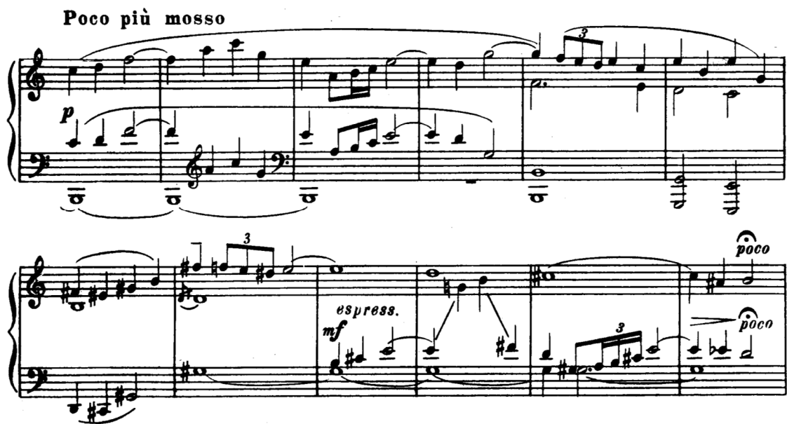
Şema 1.3: İkinci Tema

40. ölçüde başlayan ikinci tema , şimdiye kadar bölüme hükmeden şiddete lirik bir kontrast sağlar.(Örn. Şema 1.3) Rus şarkılarını andıran uzun melodik çizgi, sürekli basın üstünde duyurulur. Bu tema, Prokofiev' in ünlü balelerinde yer alan Juliet ve ya Cindirella gibi kadın kahramanları ifade eden müzięi andırır.(Berman, s. 132) 60. ölçüde melodi armonik yapıya dönüşür; sekizlik notalardan oluşan çizgi ikinci temanın farklı tonlardan duyurulmasından oluşur.Bu kısım, temanın 64. ölçüde ritmik olarak ufak deęişiklikler yapılarak yeniden duyurulmasını hazırlama görevi taşır. Burada tema orijinal sakin yapısını kaybederek, notaların hızlı akıntısının içine çekilir.