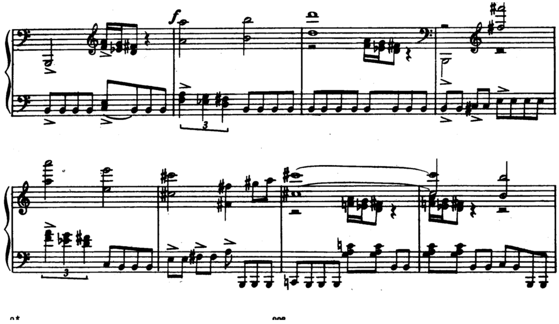
Şema 1.5: İkinci temanın genişletilmiş olarak gelmesi(f den itibaren)

157. ölçüde gelişmede yeni bir kısım başlar. Bu kısımda ikinci temayı parça parça duyarız. 169. ölçüden itibaren gelişmede kısa, birbiriyle ilişkili motiflere odaklanılır. Köprü kısmının başlangıcında duyduğumuz akorların kromatik yürüyüşünden türeyen bir motif duyarız. Aynı zamanda ikinci temanın ikinci yarısında gelen üçleme motifini anımsatan bir motif bulunmaktadır. Kapanış kısmındaki inici dört notanın izlerini taşıyan bir motif kullanılır. 185. ölçüde tiz seslerde triller duyulur.