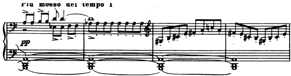
Şema 1.4: Gelişme kısmının başı

129. ölçüden itibaren, ikinci tema daha uzun bir süre biriminde ve oktavda duyularak melodinin merkezini oluşturur. Orijinalde lirik karaktere sahip olan bu tema açık tutkulu bir karaktere dönüşür.(Örn. Şema 1.5) Benzer önemli transformasyonlar Yedinci Sonat'ın gelişme kısmında da yer alır.) İki önemli temanın parçaları , aralıksız olarak çalınan sekizlik notalarla beraber melodiyi sarar. 141. ölçüden itibaren, klavyede kullanılan ses aralığı oldukça geniş bir alanı kapsar. İkinci tema, sanki bu sefer trombonla seslendiriliyormuş gibi bir sonaritede orta partide duyulur. İkinci temaya, ilk defa 142. ölçüde yer alan salkım akorlar eşlik eder. Prokofiev bu akorların col pugno (yumrukla ) çalınması gerektiğini belirtir. (Boris Volsky, Altıncı Sonat'ı öğrenip besteci için çaldığı zaman "col pugno" teriminin ne anlama geldiğini bilmiyordu ve bu akorları parmaklarıyla çalıyordu. Sergei Sergeevich bu terimin "yumrukla çal" anlamına geldiğini açıklamış ve şöyle yazmıştı "büyükanneleri korkutmak için".) (Berman, s. 133) Bu agresif tavır şiddetli havayı artırmaktadır.