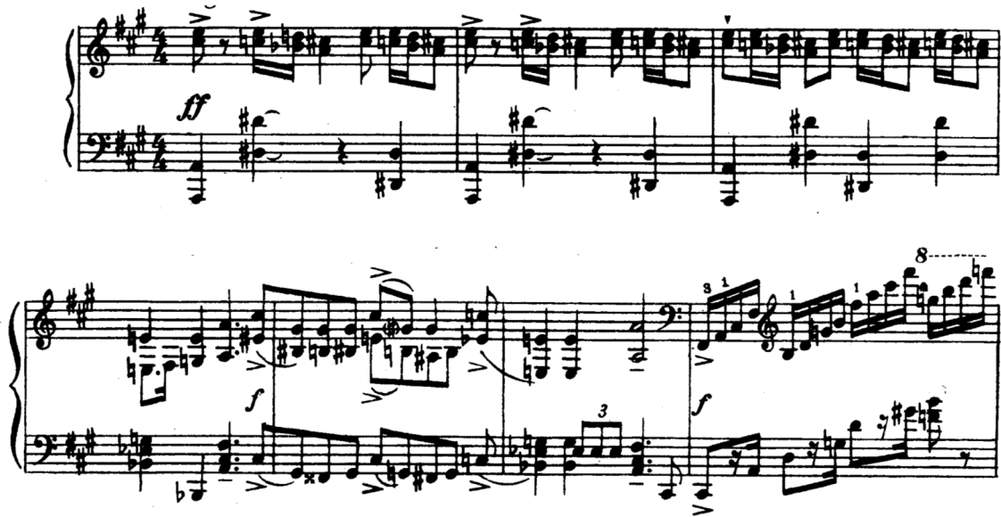
Şema 1.1 : Birinci Tema

24. ölçüde köprü kısmı başlar.(Örn. Şema 1.2) Eserde ilk defa daha yumuşak bir sonorite oluşur, fakat dramatik gerilim azalmaz. Kromatik bir biçimde yavaş ilerleyerek, orta partideki tereddütlü melodi arayışta ve kaygılı bir karaktere sahiptir. Bu karakter,