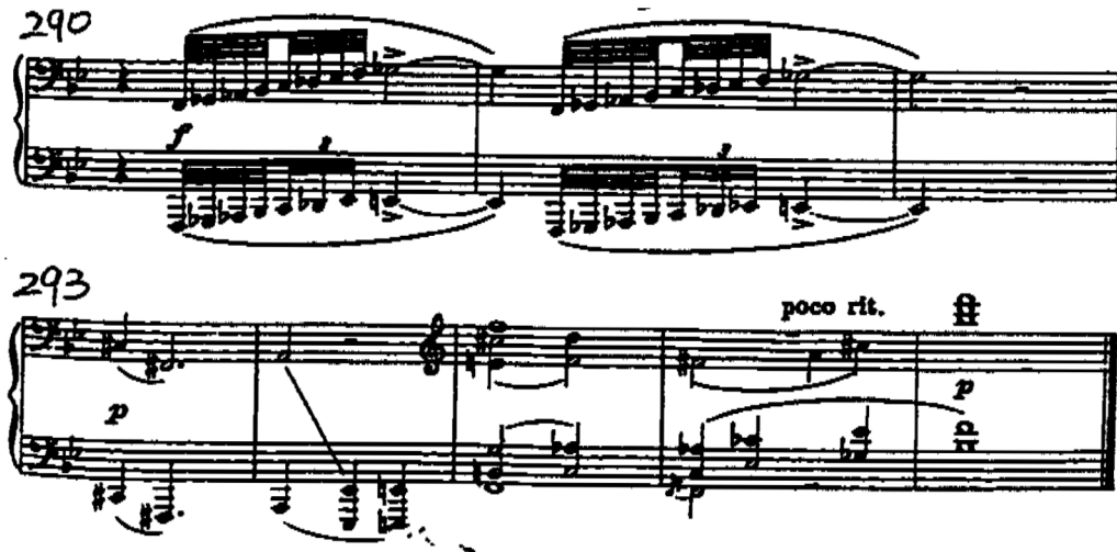
Şema 3.3: Muvmanın 290.-297. Ölçüler,

261. ölçüde başlayan koda kısmı, gelişme kısmının başında kullanılan onaltılık notalarla başlar. Önce piyano başlar ve giderek nüans atar. 286. ölçüde, aşağı doğru yuvarlanan notalarla beraber hareket çarpıcı bir biçimde kesilir. İnci hareket yapılarak iki defa daha kesilir. 290. ölçüde, glissandoyu anımsatan bir biçimde yukarı çıkılarak küçük dokuzlu aralık hissedilir. Bu aralık ikinci temanın açılışında da kullanılmıştır. Huzur dolu kapanış bu zengin muvmanın finalini yapar. (Örn, Şema 3.3.)