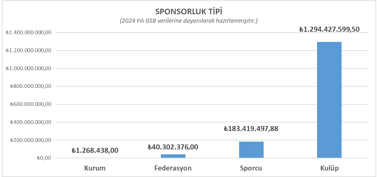
Şekil 1 109

Sponsorluk gelirleri, spor kulüplerinin gelirleri arasında önemli bir yer kaplamaktadır. Şekil 1’de görüldüğü üzere 2024 yılı için kulüplere toplamda 1.294.427.599,50 TL sponsorluk desteği sağlanmıştır. Örneğin, 2024 yılı için Galatasaray Spor Kulübü’nün sponsorluk geliri 25 milyon 850 bin Euro ve 1 milyar 183 milyon 286 bin Türk Lirasıdır. Fenerbahçe Spor Kulübü ise 1 milyon 520 bin Euro, 1 milyar 75 milyon 453 bin Türk Lirası ve 90 milyon Dolar sponsorluk gelirine sahiptir 110 .