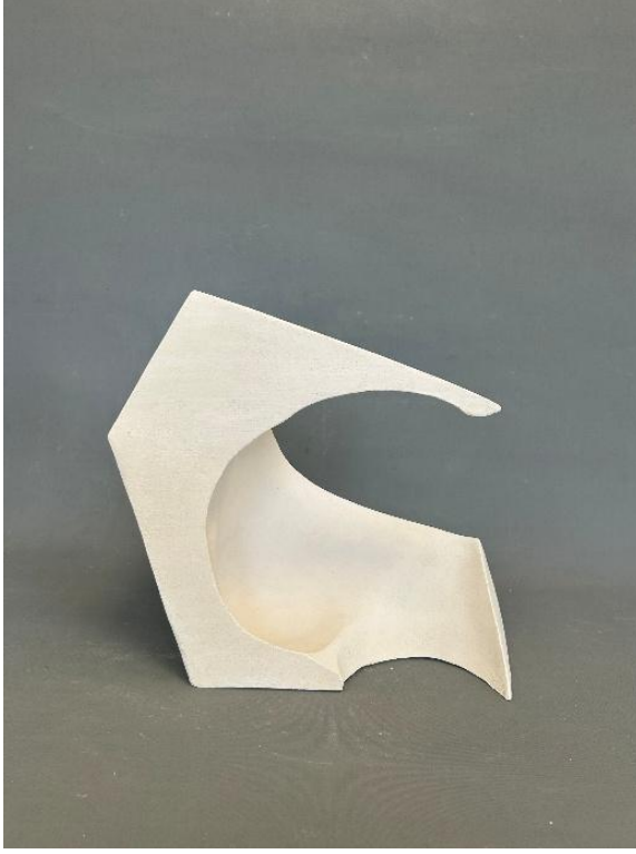
Görsel 7: Fantasma 5, Şerife Barıç Sarıkaya, 2025, (Stoneware, serbest şekillendirme, 1200°C) 30 x 28 x 23, 2025. (Kişisel Arşiv).