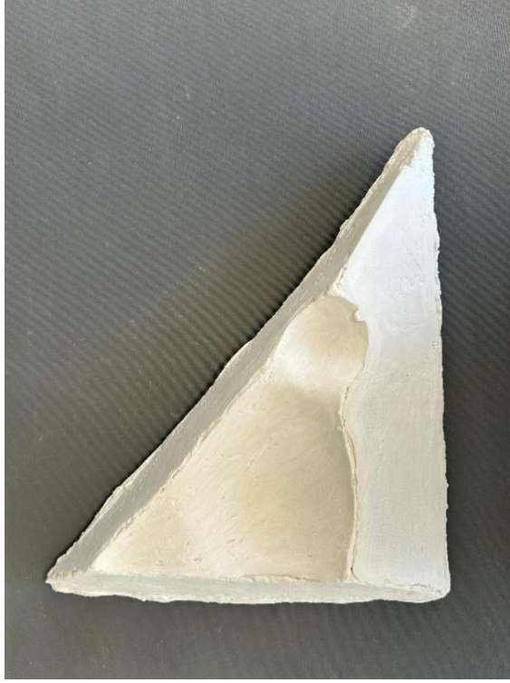
Görsel 23: Boşluk 4, Şerife Barıç Sarıkaya, 2025, (Porselen, serbest şekillendirme, 1250°C, 45 x 9 x 28). (Kişisel Arşiv).