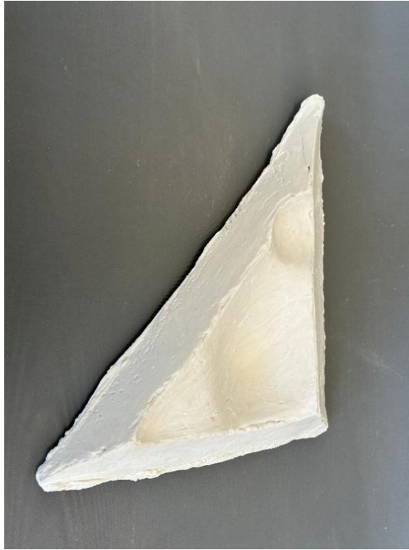
Görsel 17: Boşluk 4, Şerife Barıç Sarıkaya, detay.