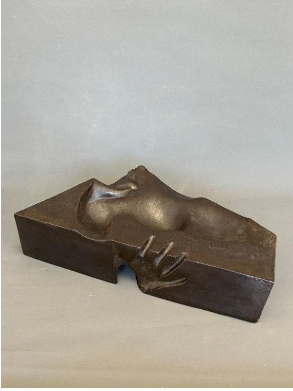
Görsel 8: Fantasma 6, Şerife Barıç Sarıkaya, 2025, (Sırlı stoneware, serbest şekillendirme, 1200°C) 48 x 32 x 14, 2025.