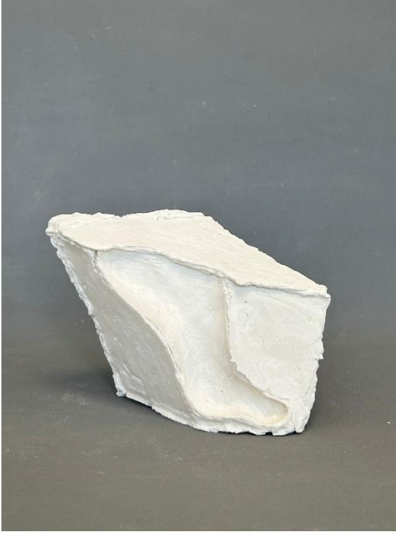
Görsel 21: Boşluk 3, Şerife Barıç Sarıkaya, 2025, (Porselen, serbest şekillendirme, 1250°C, 20 x 17,5 x 9,5).