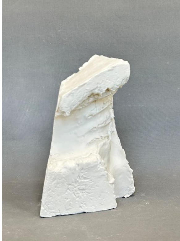
Görsel 20: Boşluk 2, Şerife Barıç Sarıkaya, detay.