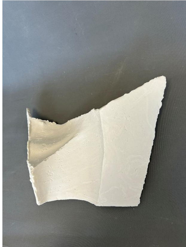
Görsel 18: Boşluk 5, Şerife Bariç Sarıkaya, detay.