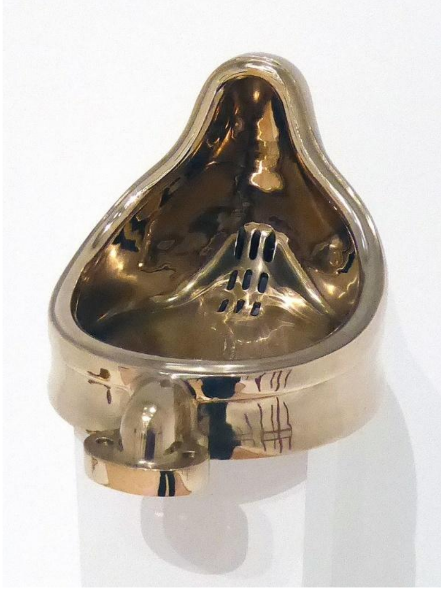
Görsel 3: Sherrie Levine, Fountain (Duchamp'dan sonra), 1991. Erişim: 19.11.2025. https://tr.wikipedia.org/wiki/Sherrie_Levine#Sanat_Eserleri