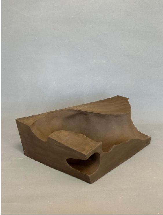
Görsel 10: Fantasma 7, Şerife Barıç Sarıkaya, 2025, (Stoneware, serbest şekillendirme, 1200°C) 47 x 21 x 18, 2025. (Kişisel Arşiv).