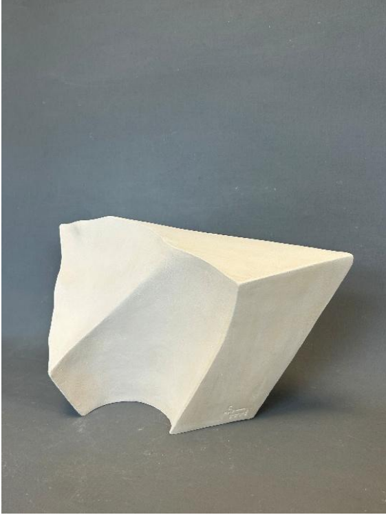
Görsel 13: Fantasma 8, Şerife Barıç Sarıkaya, 2025, (Stoneware, serbest şekillendirme, 1200°C, 40 x 11,5 x 24). (Kişisel Arşiv).

Malzeme olarak seramiğin seçimi ve kilin plastisitesi, bedeninin yokluğunun izini bir kalıntı gibi yakalamaya ve kaydetmeye olanak tanır. Fırınlama süreci ise bu geçici izi, kalıcı ve sert bir nesneye dönüştürür. Bu süreç, malzemenin kavramsal rolünü vurgulayarak seramiği sadece bir temsil aracı değil; aynı zamanda hafıza, zaman ve dönüşümün taşıyıcısı haline getirir. En temel strateji, Batı düşüncesini yapılandıran ikili karşıtlıkların altüst edilmesidir. Eser, varlık ve yokluğun karşıtlığını askıya alarak izleyiciyi “Gerçekten var olan nedir?” sorusuyla baş başa bırakır.