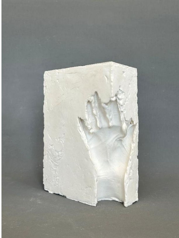
Görsel 20: Boşluk 6, Şerife Bariç Sarıkaya, detay.