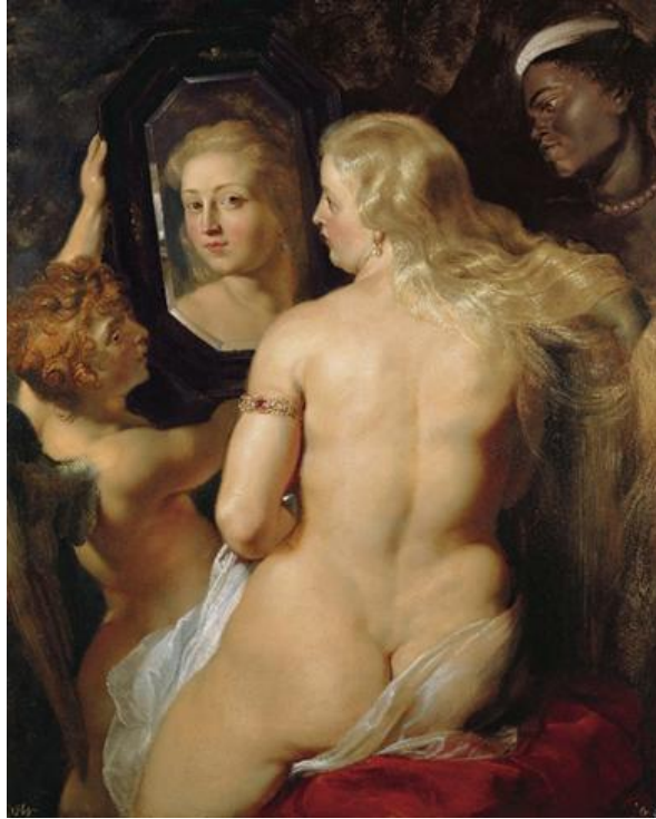
Görsel 6: Pieter Paul Rubens, Ayna Karşısındaki Venüs, 1614, TÜYB, 76x61 cm. Erişim: 08.03.2026. https://www.artchive.com/artwork/venus-at-her-toilet-peter-paul-rubens-1608/