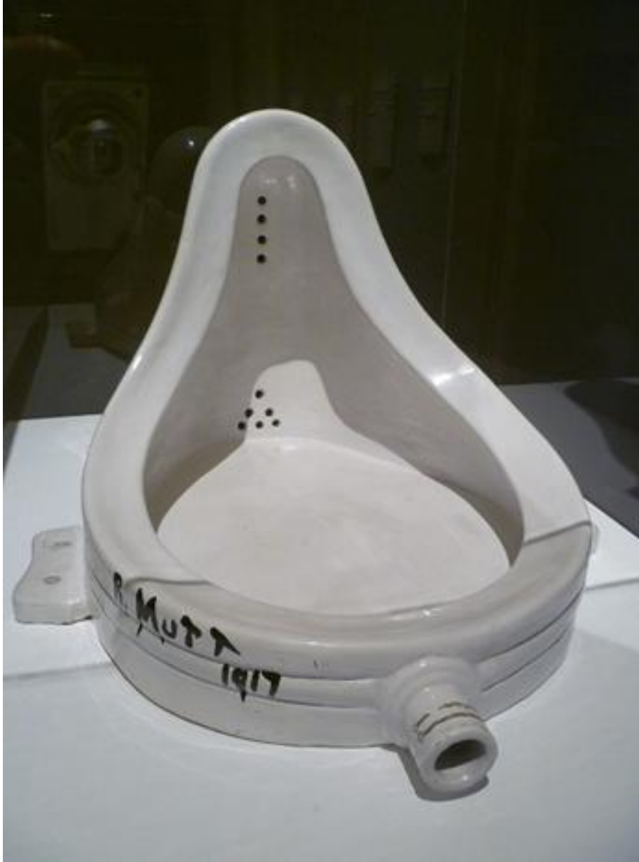
Görsel 4: Marcel Duchamp, "Fountain (Çeşme/Pisuar)" 1917. Erişim: 19.11.2025. https://tr.wikipedia.org/wiki/Fountain_(Duchamp)