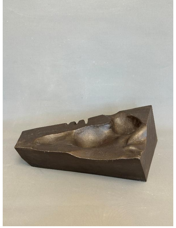
Görsel 9: Fantasma 6, Şerife Barıç Sarıkaya, detay. (Kişisel Arşiv).