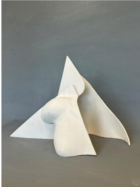
Görsel 14: Kabuk, Şerife Barıç Sarıkaya, detay. (Kişisel Arşiv).