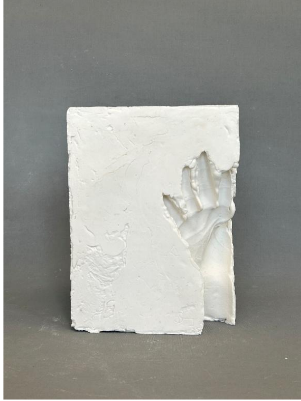
Görsel 19: Boşluk 6, Şerife Bariç Sarıkaya, 2025, (Porselen, serbest şekillendirme, 1250°C, 17 x 23 x 8). (Kişisel Arşiv).