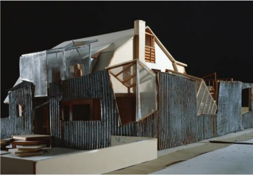
Görse1 2: Frank Gehry, Gehry Residence Modeli, Ölçüler 41 x 183 x 122,1 cm, MAK - Avusturya Uygulamalı Sanatlar / Çağdaş Sanat Müzesi, Viyana. Erişim: 11.07.2025. https://www.artsy.net/artwork/frank-gehry-gehry-residence-model-santa-monica-california