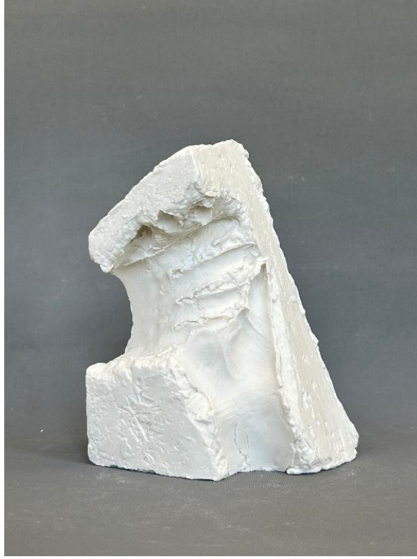
Görsel 19: Boşluk 2, Şerife Barıç Sarıkaya, 2025, (Porselen, serbest şekillendirme, 1250°C, 26 x 17,5 x 12).