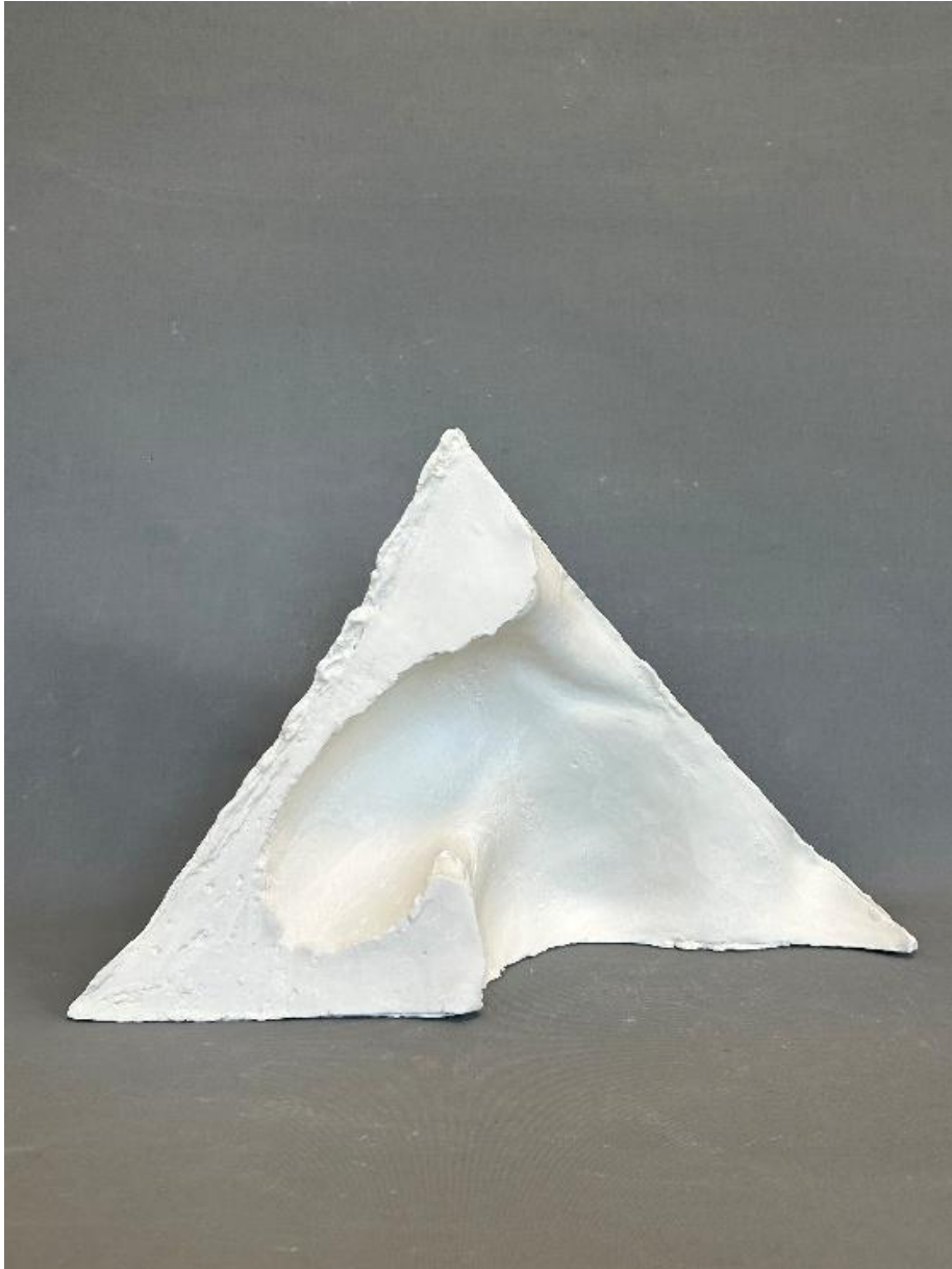
Görsel 15: Boşluk, Şerife Barıç Sarıkaya, 2025, (Porselen, serbest şekillendirme, 1250°C, 45 x 18 x 27,5). (Kişisel Arşiv).

Bu bağlamda ortaya çıkan “Kabuk” çalışması (Görsel 15-16), beden maddesel varlığını koruma çabasından ziyade, o varlığın geride bıraktığı boşluğa odaklanmaktadır. Bu çalışmada seramik malzeme, bedeni hapseden bir kütle olmaktan çıkarak; içteki yokluğu muhafaza eden, kırılabilir ve geçirgen bir katmana dönüşür. Kabuk, burada hem bir koruma kalkanı hem de içteki yokluğun somut sınır çizgisidir. Bu yaklaşım, medya tarafından dayatılan cinselleştirilmiş ve sabitlenmiş kadın imgelerini silerek, bedeni özgürleşmiş bir “negatif hacim” olarak sunar.