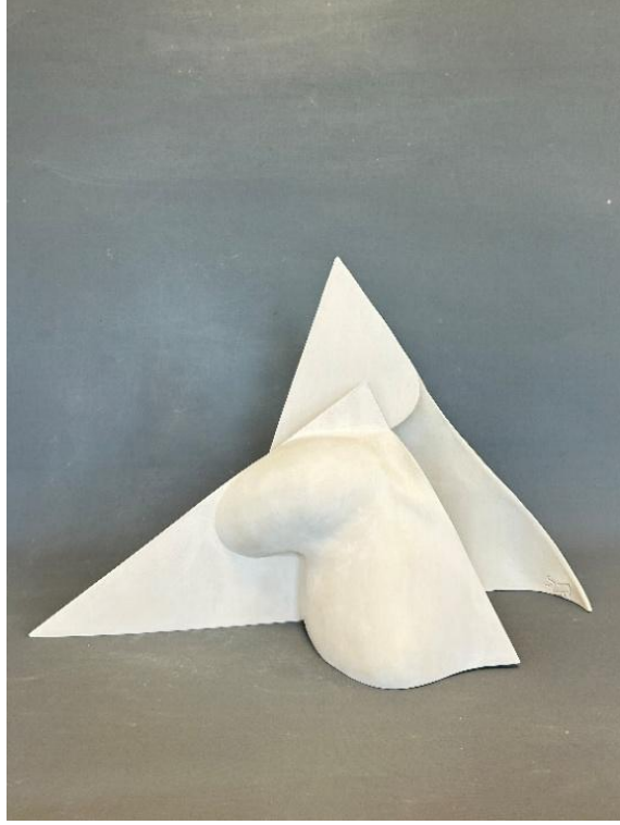
Görsel 15: Kabuk, Şerife Barıç Sarıkaya, 2025, (Stoneware, serbest şekillendirme, 1200°C, 56 x 23 x 36). (Kişisel Arşiv).