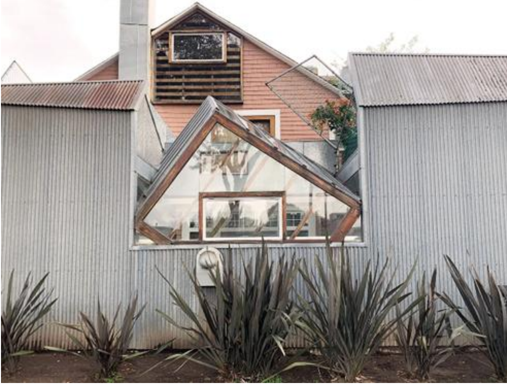
Görse1 1: Frank Gehry, Gehry House, Santa Monica, California, 1978.