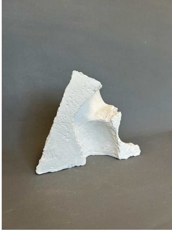
Görsel 29: Boşluk 7, Şerife Bariç Sarıkaya, 2025, (Porselen, serbest şekillendirme, 1250°C, 36 x 7 x 28,5). (Kişisel Arşiv).