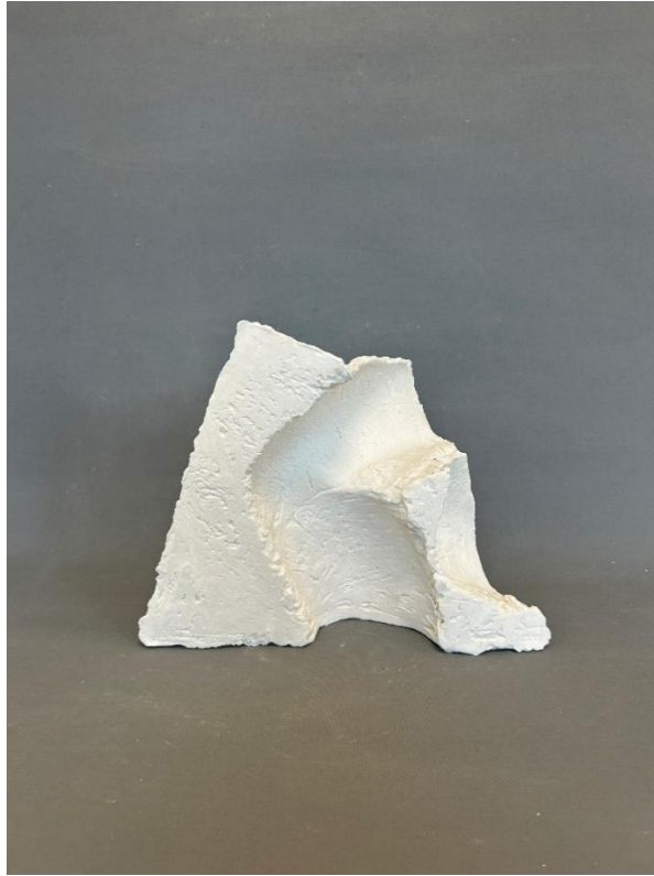
Görsel 30: Boşluk 7, Şerife Bariç Sarıkaya, detay.