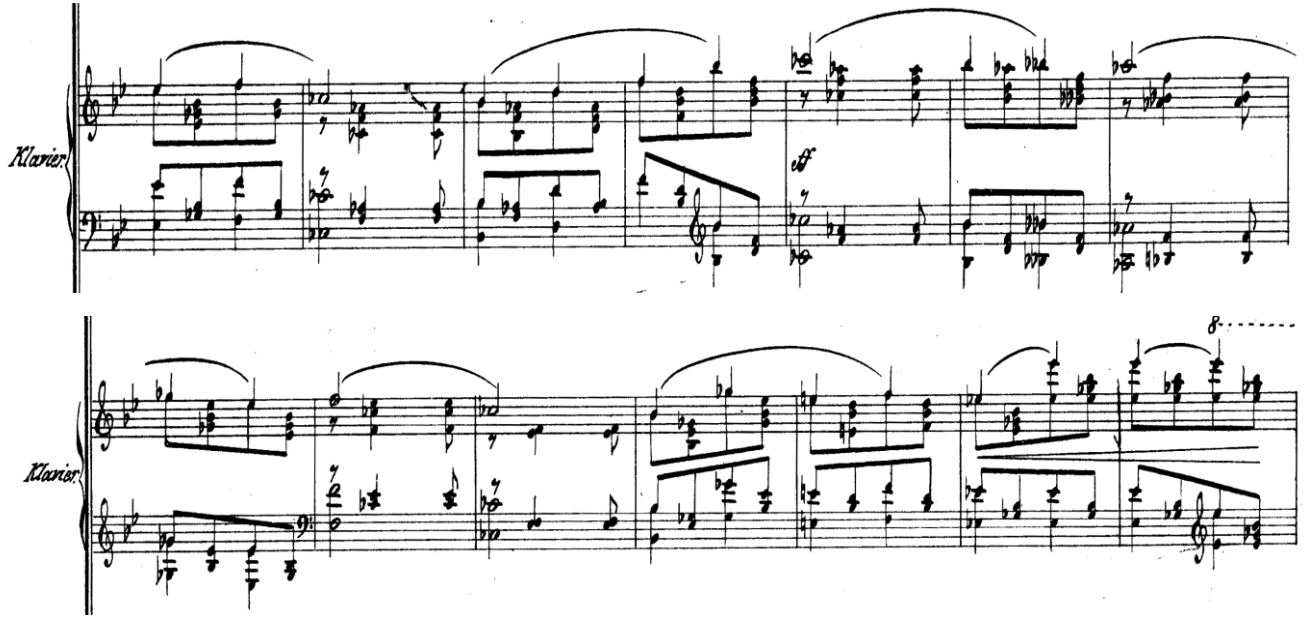
Görsel 18: 229-244. Ölçüler, C teması.

http://ks.imslp.info/files/imglnks/usimg/0/06/IMSLP220172-SIBLEY1802.15587.6db0-39087009358294score.pdf