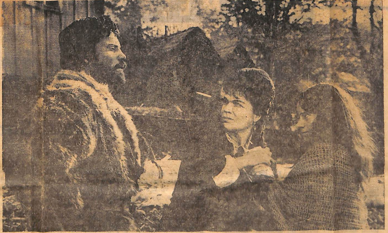
OLIVIER REED VE RITA TUSHINGHAM „TUZAK”TA «Gerçekten güzel bir tabiat filmi»

İki arkadaş — beş arkadaşlık bir grup olarak daha önce sergiler açmışlardı — plâstik değerleri belirtmek yolunda başarılı örnekler veriyorlar. Kalabalık sahneler, oyun oynayanların elleri, granit parçalarının grafikleri, gölgelerin değerleri, siyah-beyaz oyunları, bu arada ve meselâ artık kaybolmağa mahkum fayton arabacısı gibi mahallî renk taşıyan konular ile sergi dikkati çekiyor.