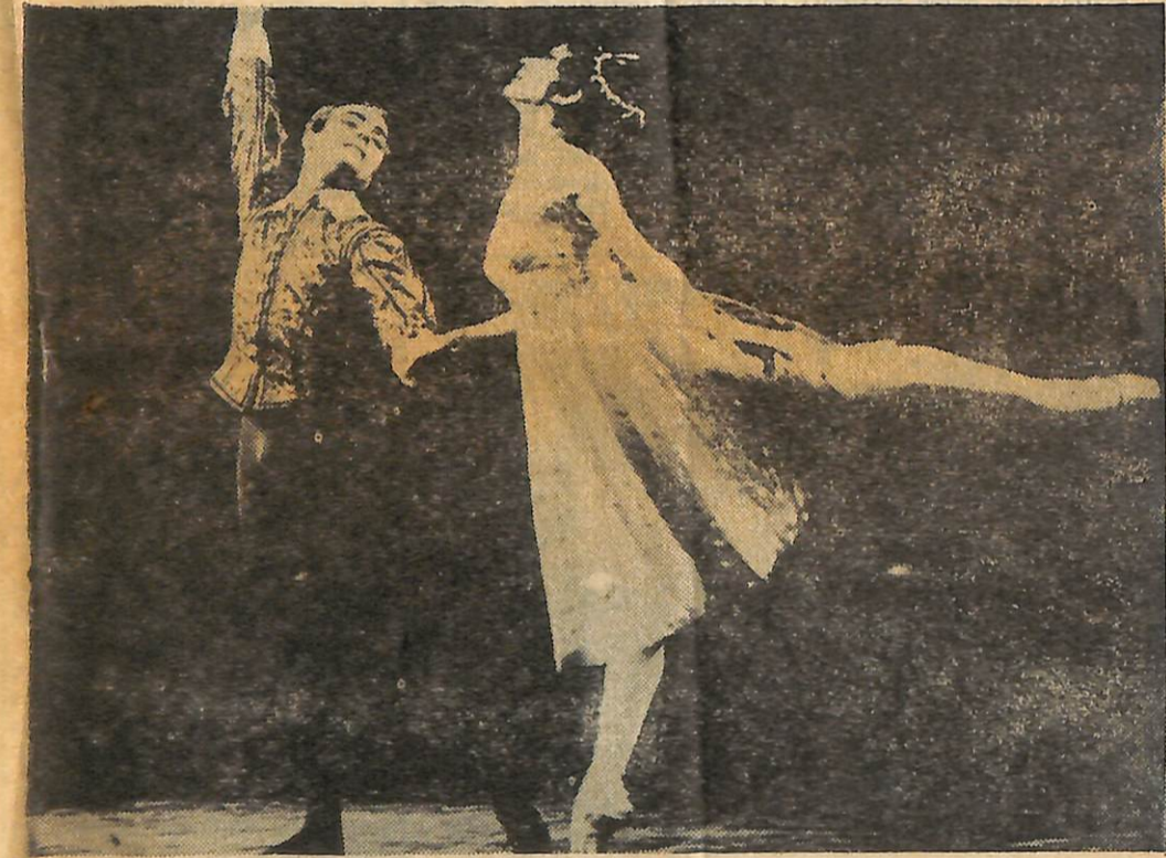
İstanbul ve Ankara'da temsiller verecek olan İngiltere'nin meşhur Londra Festival Balesi sanatçılarından Galina Samtsova ile John Gilpin.