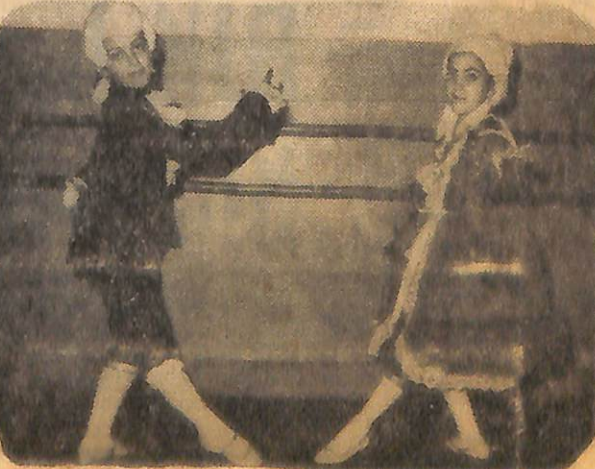
VE YINE İki küçük balerin tarihi kıyafetlerle bale gösterileri yaparken...