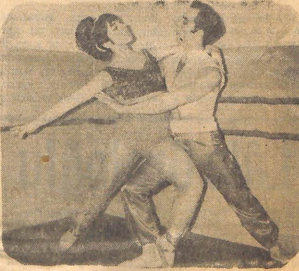
ERKEK eşliğinde bale gösterileri yapan bir balerin müzik refakatinde gösteriler sırasında...