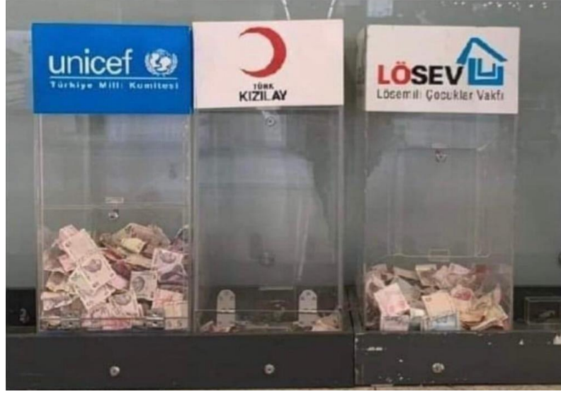
Şekil 1. Sivil Toplum Kuruluşlarına Yardım

6 Şubat depremlerinin ardından sivil toplum, depremzedelere hızlı yardım sağlamak için önemli bir dayanışma gösterdi. Öte yandan, devletin sınırlılıklarının ve bürokratik süreçlerin, insani yardım çalışmaları arasında koordinasyon eksikliğine sebep olduğu yönünde tartışıldı. Yerel düzeyde ve ulusal boyutta yapılan çalışmalar, uluslararası ölçekteki yardım kampanyalarından bağımsız kaldı. Hem ulusal hem de uluslararası yardım hareketleri arasında gerekli iletişim ve koordinasyon sağlanması etkililiği arttırabilirdi. (Garipoğlu, 2023) Devlet kurumları, halkın yanı sıra tanınmış akademisyenler, araştırmacılar, gazeteciler ve bilim insanları tarafından, hükümetin inşaat sektörüyle bağlantılı politikalarının depreme karşı savunmasızlığı arttırdığı ve depreme müdahale ile arama-kurtarma lojistik çalışmalarının yetersiz olduğu yönünde eleştirildi.