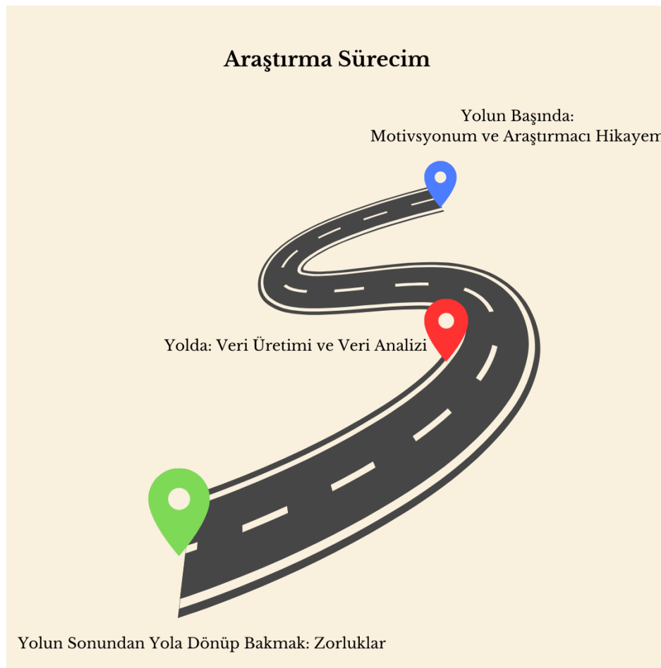
Şekil 1. Araştırma Sürecim