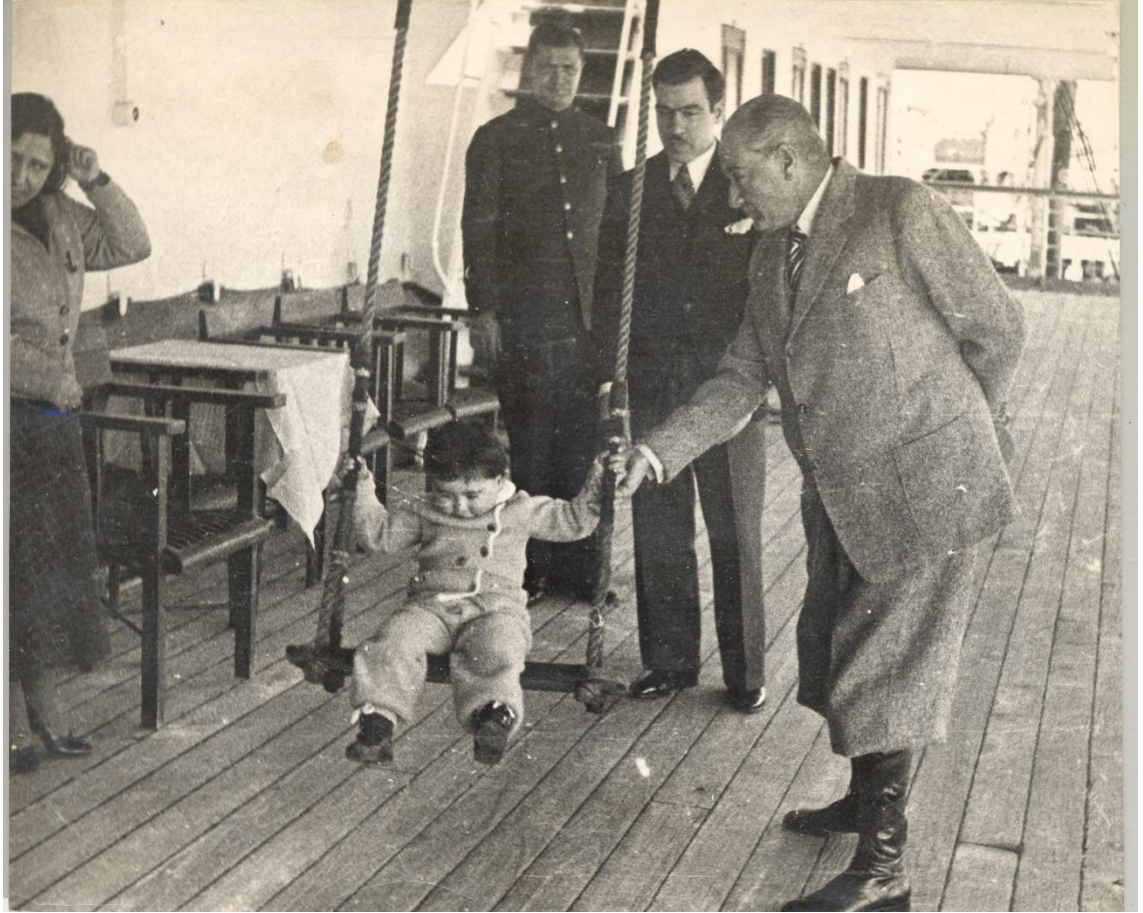
Ek 15. Atatürk ve Manevi Kızı Ülkü