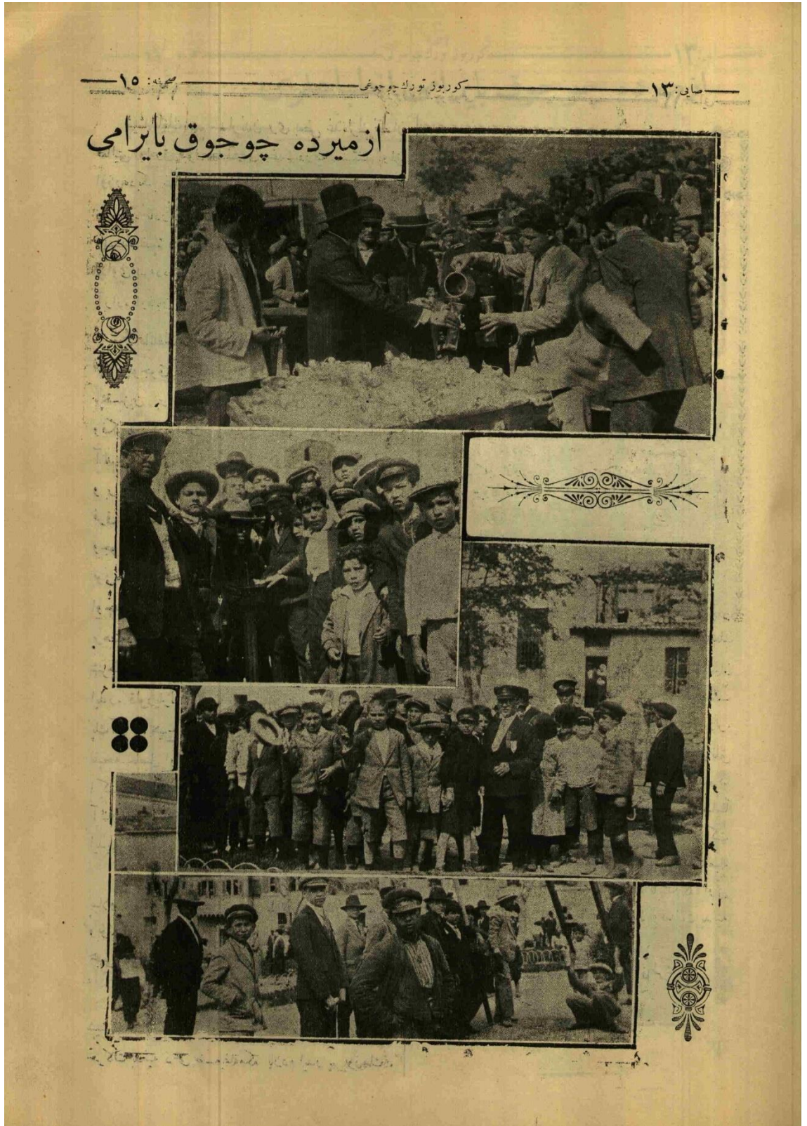
Ek 11. "İzmir'de Çocuk Bayramı" 223