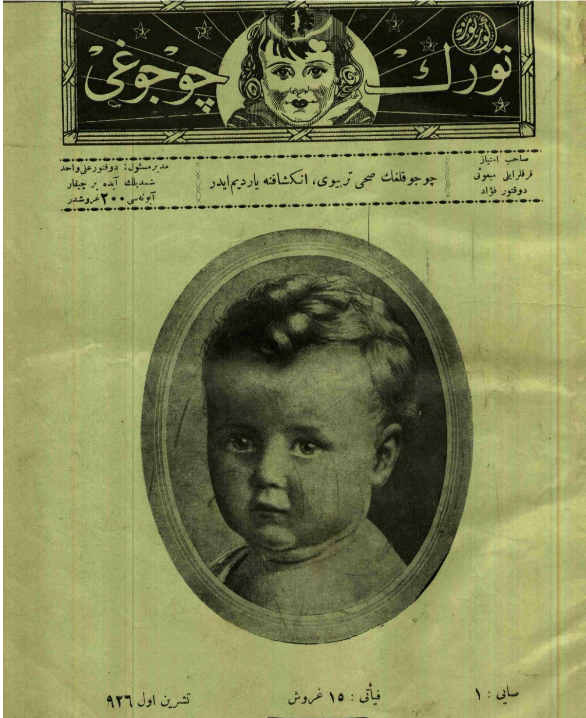
Ek 3. Gürbüz Türk Çocuğu Dergisi'nin ilk sayısının kapak sayfasında bir gürbüz çocuk örneği 218