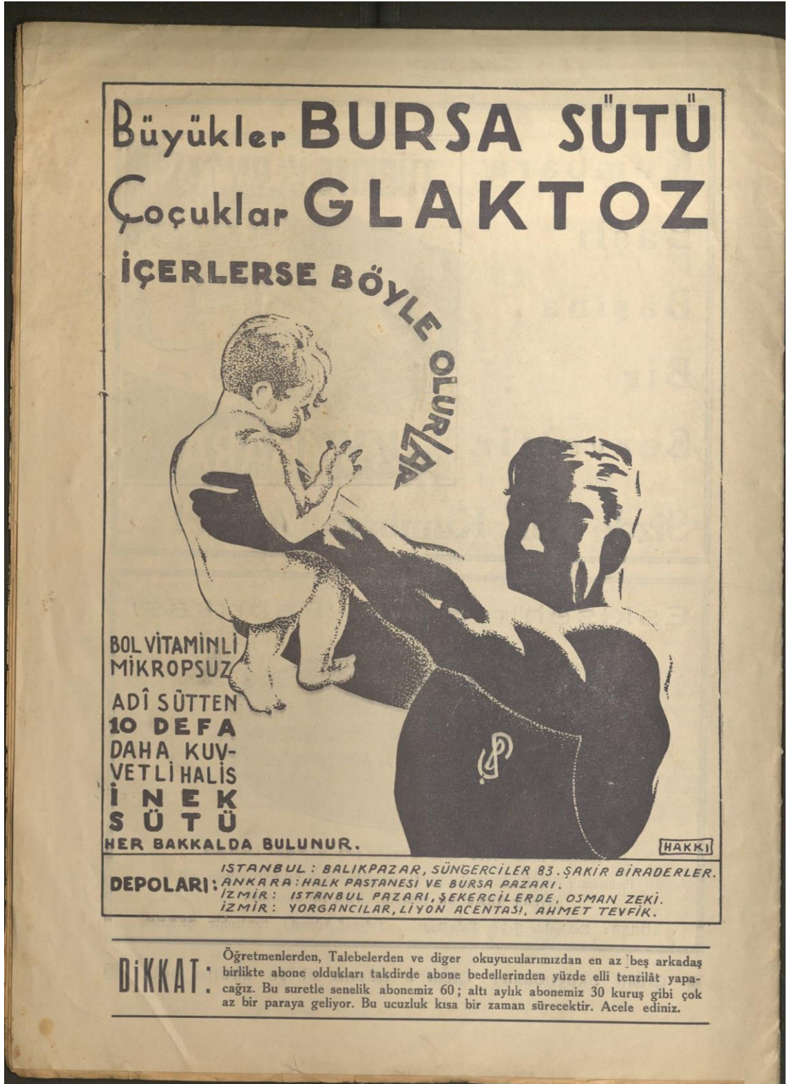
Ek 8. 1935 senesine ait bir st reklamı 220