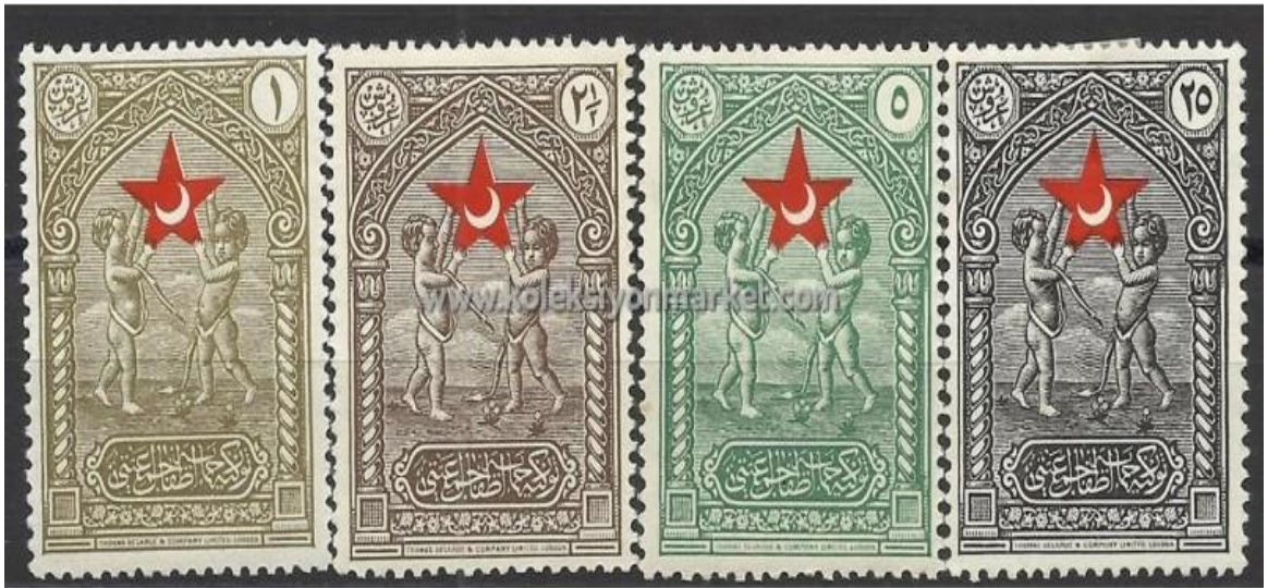
Ek 5. Himaye-i Etfal Cemiyeti Yardım Pulu(1928)