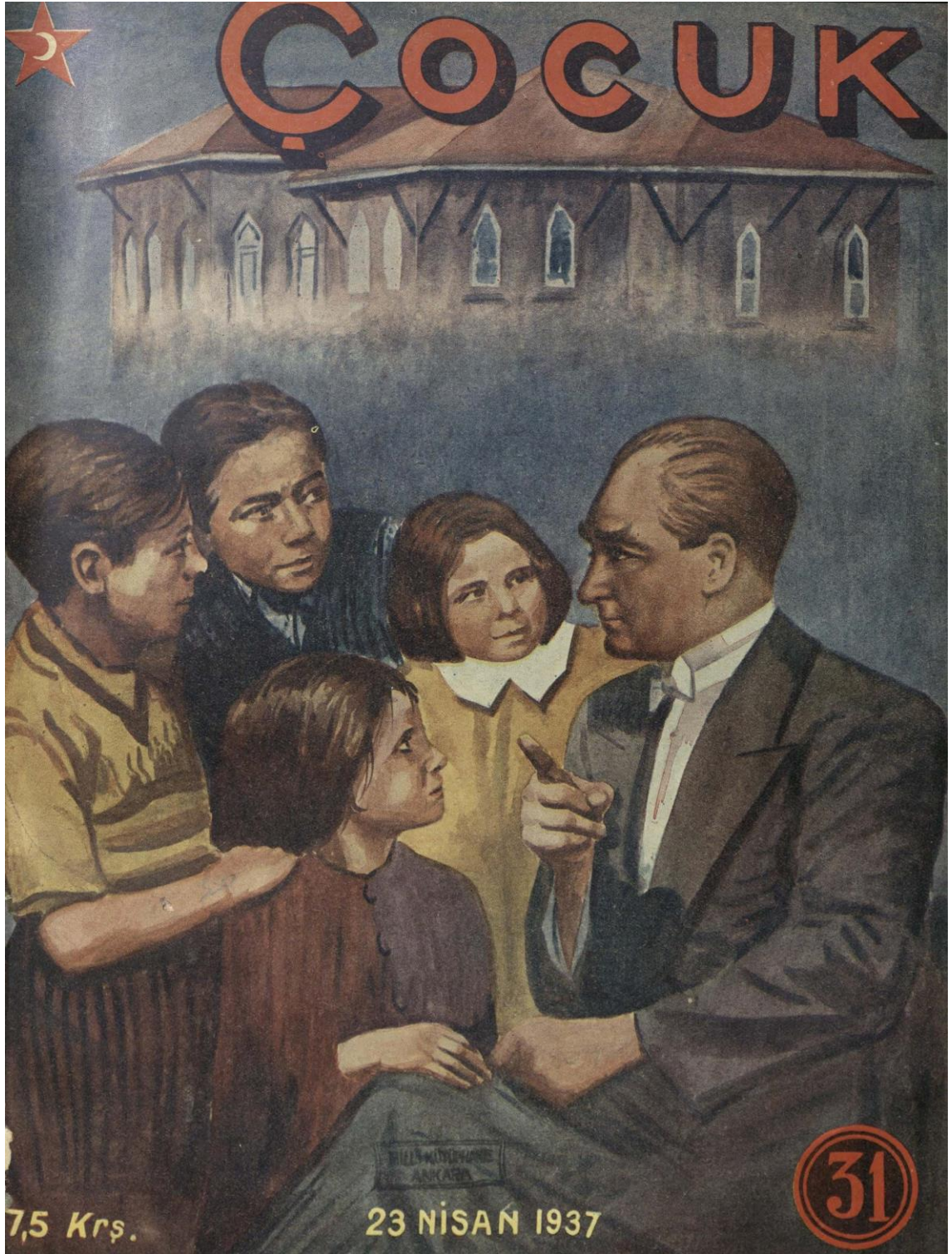
Ek 13. 23 Nisan'da Atatürk ve çocuklar. 225