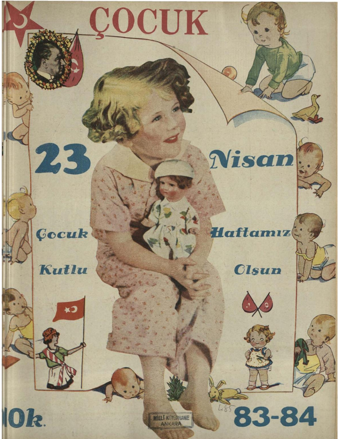
Ek 14. Çocuk Haftası'na özel 226