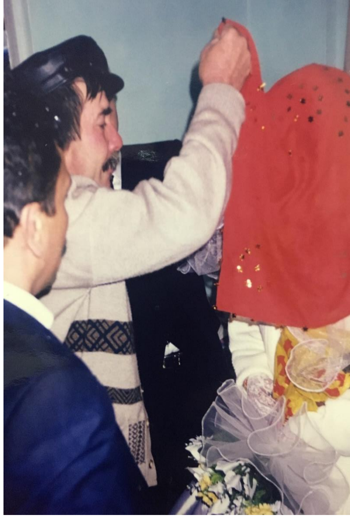
FOTOĞRAF 10: Gelinin Erkek Evine Geldiği Zaman Kayınpederi Tarafından Hediye Verildiği Görüntü.

Evin kapısına gelindiği zaman gelinin eline mal yağı denilen katı bir yağ verilerek kapının arkasına sürmesi istenir. Tereyağının ağızda keyif verici bir tat bırakarak mutluluk vermesinden kaynaklı olarak gelinin de ağzının tadı yağlı ballı olması inancıyla yapılırdı. Bir diğer anlamı da gelinin eve yağ gibi sıvanmasını, yapışıp kalması amacıyla yapılırdı. Böylelikle hem bereketli hem de evde huzurlu olması için de yapılır. Gelin ve damat erkek evine bu şekilde ritüellerle girene kadar evde kimse bulundurulmaz. Eskiden evlerde bacası büyük geniş ocaklıklar olurdu. Ocağa bağlı büyük demir zincirler olurdu ve zincirlere bağlı kara kazanlarda yemekler pişerdi. Gelinin de erkek evine girdikten sonra ilk olarak bu ocağı yani ateşi demir çubukla karıştırılması istenirdi. Bunun yapılmasının nedeni de evine ocağına bağlı olsun, ekmecli, ocaklı olsun diye yapılırdı. Günümüzde de