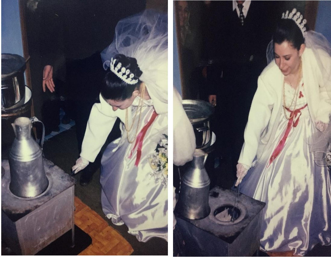
FOTOĞRAF 11-12 Gelinin Erkek Evine Geldiğinde Ocağı Karıştırdığına Dair Görüntü.

evde eğer bu şekilde ocaklar bulunmuyorsa tüplü ya da doğalgazlı ocakların gazının açılıp kapatılmasıyla ritüel yaşatılmaktadır.