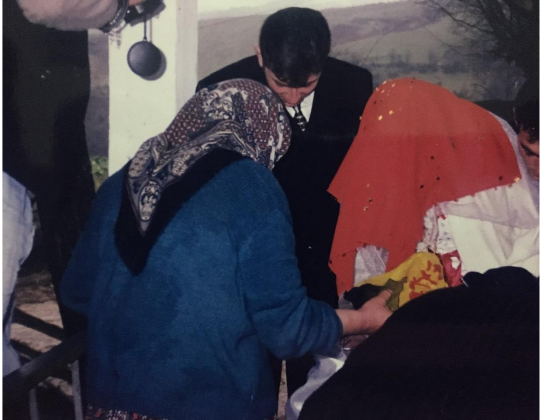
FOTOĞRAF 9: Gelinin Erkek Evine Geldiği Zaman Ayağında Bardak Kırdırğı Görüntü.

zamanda koltuk altındaki ekmek başında kırılır. Böylece bereketlilik artardı. Sonrasında gelinin kendi evinden getirdiği bardak kırdırılırdı. Yörede bunun yapılmasının pek çok nedeni bulunmaktadır. Hem nazar varsa onun çıkması için hem sonrasında kaza bela çıkmaması için baştan bardak kırdırılarak bunun engellenmesi için hem de bereketinin bu evde devam ettirmesi sağlanırdı.