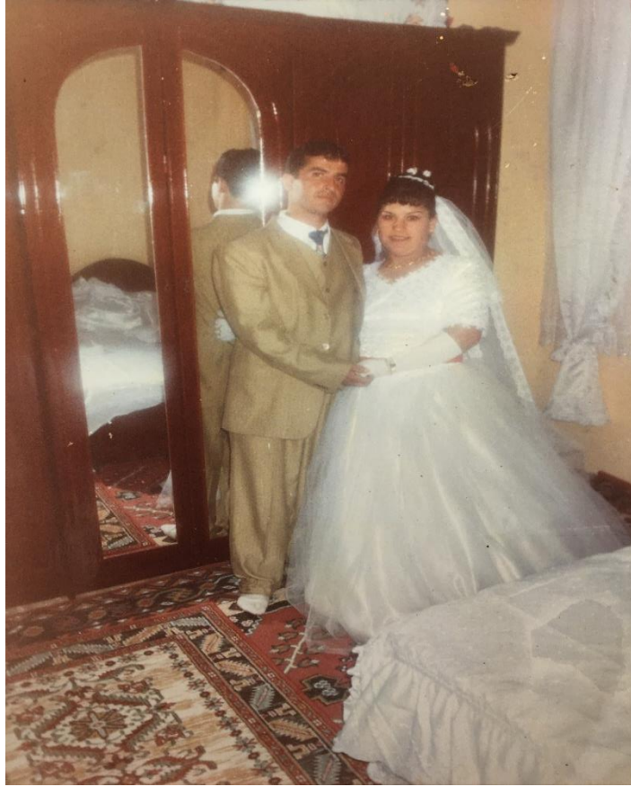
FOTOĞRAF 13: Düğün Günü Gelin ve Damadın Kendi Odalarından Bir Görüntü