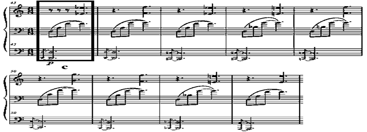
Görsel 6. Hatıra Ahmedli Cafer, Sonat – 613, sergi bölümü, tema 2, b2 cümlesi (Ö. 45-53)

Hatıra Ahmedli Cafer ile yapılan ikili görüşmede, besteci bu bölümün Kremlin Saati 'ne bir gönderme olduğunu vurgulamıştır (Cafer, Kişisel iletişim, 24.01.2020). Bu durum bir bakıma yaşanan trajedide Rusya'nın da rolü olduğunu sembolize etmektedir. Besteci; Kremlin saat kulelerindeki saatlerin 15 dakikada bir çalması ne kadar kesinse, bu olayda yaşanan trajedide Rusya'nın rolünün büyük olduğunu o kadar kesin olduğunu ifade etmiş ve Ermeni faşizanlarının kendi başlarına saldıracak güçleri olmadığını söylemiştir. Böylelikle burada da sembolizmden yararlanılmıştır.