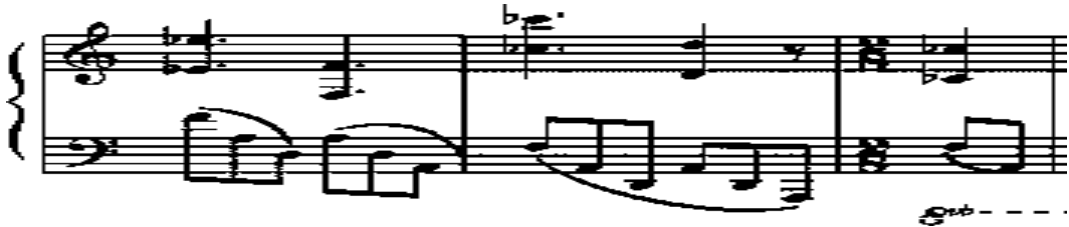
Görsel 7. Hatıra Ahmedli Cafer, Sonat – 613, sergi bölümü, tema 2, köprü (Ö. 54-56)

54. ölçüden itibaren b2 cümlesine ait tematik yapı inici bir hareketle üç ölçü boyunca tamamlayıcı bir köprü görevini üstlenerek sergi bölümünü gelişme bölümüne bağlamaktadır.