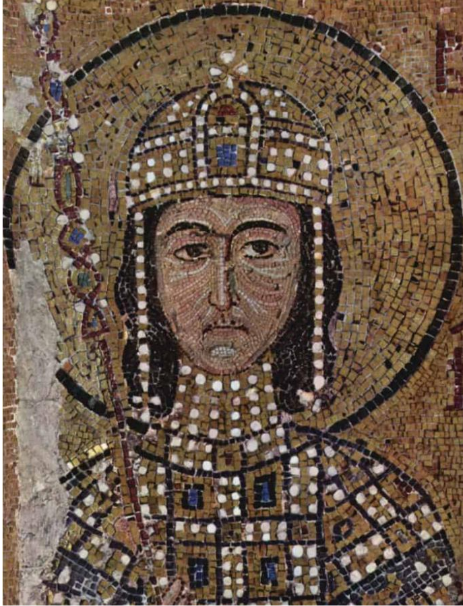
Ek 1: Komnenos hanedanının kurucusu İmparator I. Aleksios Komnenos. 287