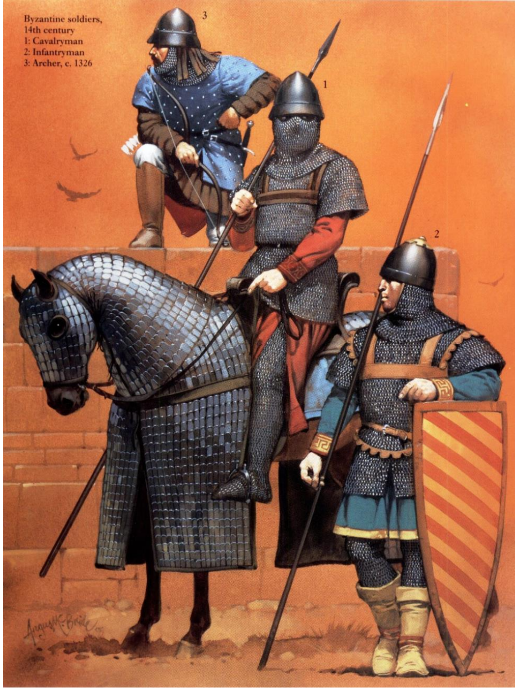
Ek 8: 14. yüzyıl Bizans askerleri. 294