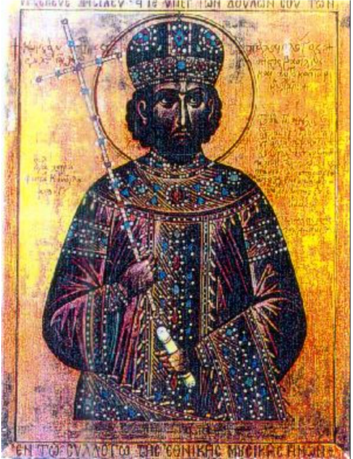
Ek 7: Son Bizans İmparatoru XI. Konstantinos Paleologos. 293