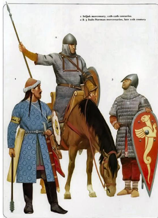
Ek 4: Geç 11. yüzyıl Bizans ordusunda Selçuklu ve Norman paralı askerler. 290