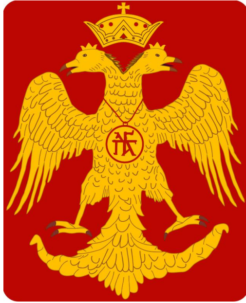
Ek 6: Paleologos hanedan arması. 292