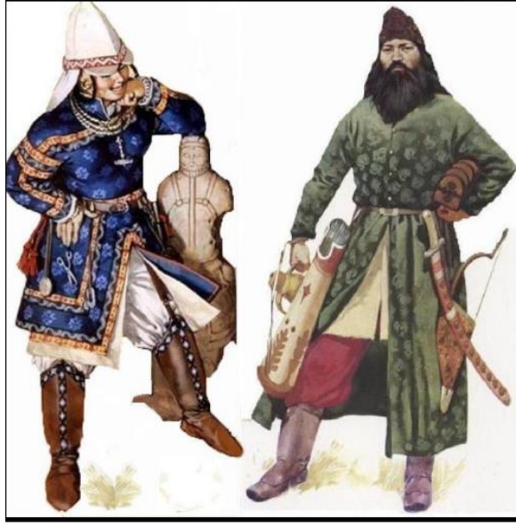
Ek 5: Peçenek kadını ve Peçenek savaşçısı. 291