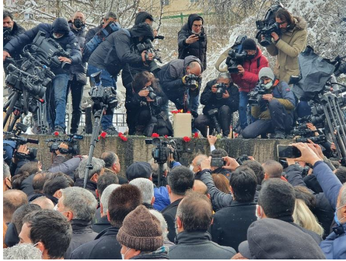
Anma etkinliklerinde politikacılar anıta karanfil ve mum bırakırken.