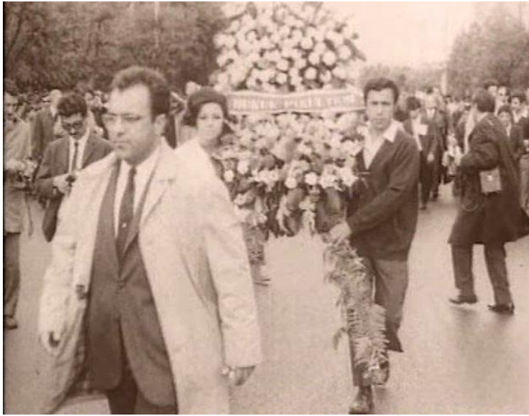
Görüşmecinin bahsettiği Anayasaya Saygı yürüyüşünde Uğur Mumcu (Onedio web sitesi, 2021).

“O cenazeye gelen kalabalık çok önemliydi. Yağmurlu bir hava vardı, semsiyeler, sokağın dolması, insanların jestleri- mimikleri hala belleğimde. Görsel olarak çok etkileyiciydi... Uğur Mumcu'nun cenazesi kadar etkileyici bir başka tören, zamanın Yargıtay Başkanı İmran Öktem'in cenazesinden sonra yapılan bir anayasaya saygı yürüyüşüydü. 2 Ben o zaman öğrenciydim. İlginçtir, yürüyüşün başında Uğur Mumcu vardı.” (A, erkek, ressam, 70)