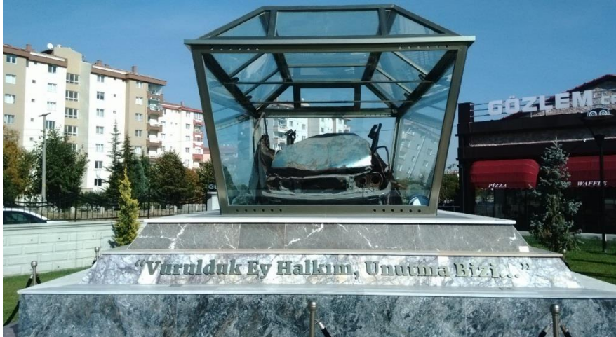
Eskişehir’deki Uğur Mumcu Parkı’nda yer alan anıt (Funda Altun arşivi).

Ankara ve Türkiye’nin pek çok şehrinde geçen yıllar içinde, Uğur Mumcu adına anıtlar, heykeller yapıldı, sokaklara, caddelere, parklara ve okullara onun ismi verildi. Ankara’da Uğur Mumcu’nun evinin olduğu sokağın bağlandığı caddenin ismi “Uğur Mumcu Caddesi” iken, evin bulunduğu sokağın adı da “Uğur Mumcu’nun Sokağı” olarak değiştirildi. Evin karşısında yer alan anıtın bulunduğu parkın ismi ise “Uğur Mumcu Parkı”. Bu bölümde “suçun anıtlarına” dair veriler aktarılacaktır. Böylelikle toplumsal bellekte adaletsizlik sorunsalının nasıl “anıtlara dönüştüğü” irdelenebilecektir. Bir görüşmeci şöyle bir kanaatini ortaya koymuştur;