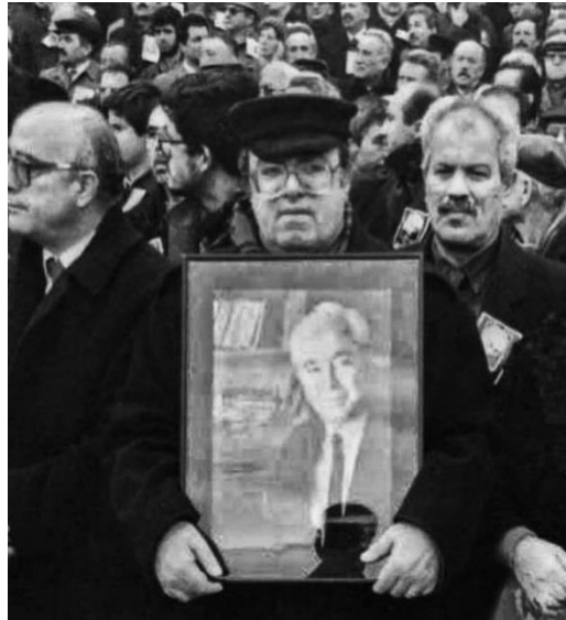
Uğur Mumcu, Muammer Aksoy'un cenaze töreninde.

Atatürkçü Düşünce Derneği'nin kurucusu, hukuk profesörü, 61 Anayasası'nın yazılmasına ilişkin oluşturulan kurucu meclisin parlamenti, bir dönem Ankara Barosu başkanlığını da yürüten, CHP milletvekili, yazar ve siyasetçi Muammer Aksoy 31 Ocak 1990 günü evinin önünde kurşunlanarak öldürüldü. Ertesi gün Uğur Mumcu (Mumcu, 1990, Cumhuriyet gazetesi) Cumhuriyet gazetesindeki köşe yazısında Muammer Aksoy'u ve ölümünü anlattıktan sonra yazısını "... hepimizin ve hepimizin başı sağ olsun. Ah hocam, ah, ah, ah." diye bitirmiştir". "Hocasının" cenaze merasimi 3 Şubat 1990 günü düzenlenmiş ve Uğur Mumcu da onun resmini cenaze kortejinin en önünde taşımıştır.