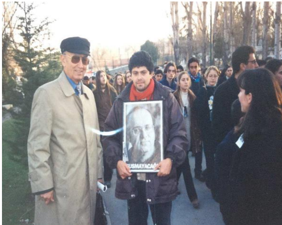
1994 yılındaki anmadan

Bu bölümde son olarak, araştırma sürecine de katılımcı olarak katkı sonmuş olan İ.’nin (erkek, 50, öğretmen) iki ayrı fotoğrafına aşağıda yer vermek uygun olacaktır. Bu fotoğraflar, yapılan anma etkinliklerinin zamana nasıl da meydan okuduğunu göstermesi açısından seçilmiştir. Tezin değişik bölümlerinde ara ara vurgulanan ve aslında Uğur Mumcu anmalarını pek çok yönden “ilgi çekici” hale getiren, onu anan insan topluluklarının bu konudaki ısrarıdır. Aşağıdaki iki fotoğraf arasındaki süre 23 yıldır. Bu geçen 23 yıl boyunca İ. (soldaki fotoğrafta sağ tarafta yer alan) tüm anma etkinliklerine katılmıştır.