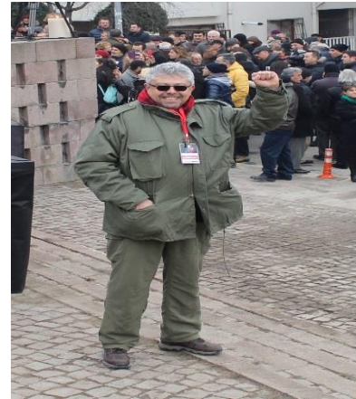
2017 yılındaki anmadan