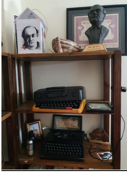
Uğur Mumcu ve Ahmet Taner Kışlalı'ya ait olduğu ifade edilen daktilolar.

İkisi de cinayetlere kurban gitmiş iki ayrı yazara ait daktilolardan oluşan bu köşe bir başka ve özgün “suç anıtı” olarak görülebilir. Öldürülen kişilerden geri kalanlar, adeta birer “kutsal emanet” gibi saklanmakta, bu emanetlerden oluşan evin köşesi ise gören kişilere işlenen cinayetleri hatırlatmaktadır. Gösteren kişi ise kimliğini bu semboller üzerinden topluluğa sunmaktadır.