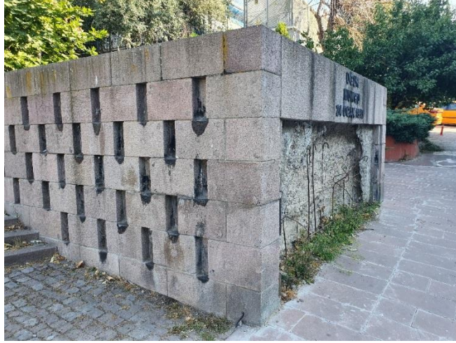
Bir başka açıdan anıt. Oluklarda, önceki yapılan anma etkinliklerinden kalan erimiş mumlar.