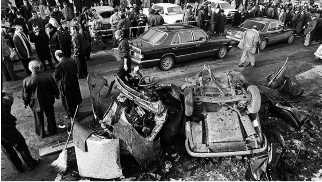
Suikastın hemen sonrası. Fotoğrafçı Rıza Ezer. (Hürriyet gazetesi, 2020)

Görüşmelerde nadiren de olsa bazı katılımcıların, patlamayla havaya uçan otomobilin ne denli mütevazı bir araç olduğuna dair tespitlerini vurguladıkları görülmüştür. Bir tabakalaşma sembolü olarak arabanın marka ve modeli ile Uğur Mumcu'nun yaşadığı hayatın tutarlılığının altı çizilmiştir;