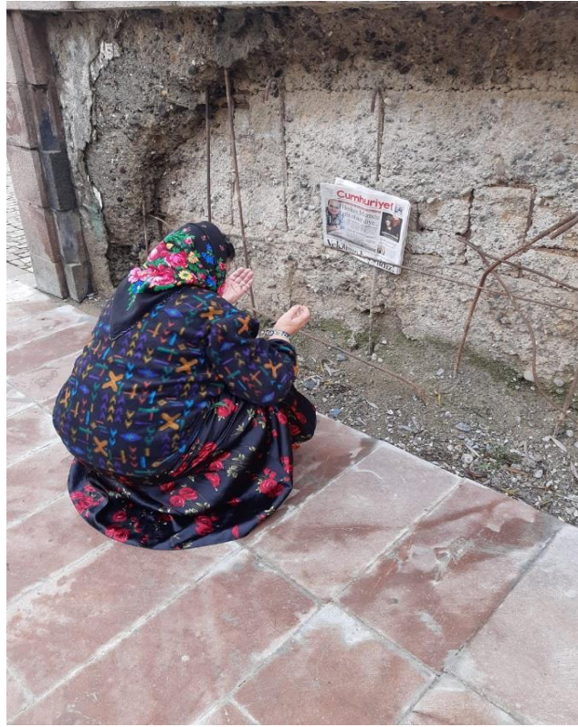
Uğur Mumcu'nun evinin önündeki anıtta bir kadın dua ederken.

Görüşmeciler kimi katılımcıların anıta dönük olarak dua ettiklerini ifade etmiş, buna dair kendi çektikleri fotoğrafları araştırmacıya ulaştırmışlardır. Keza Mumcu'nun mezarı başındaki anma törenine de, o sırada kendi yakınlarının kabirlerini ziyaret etmek üzere tesadüfen orada bulunan insanların da katıldığını, kimi kişilerin mezar taşına ellerini sürüp, kendi göğüslerine götürdüklerini söylemişlerdir. Bir başka görüşmeci Uğur Mumcu için şiir yazanlar insanlar olduğunu, bu kişilerin kalabalığın ortasında aniden ve coşkuyla yüksek sesle şiirleri okumaya başladıklarını ifade etmiştir.