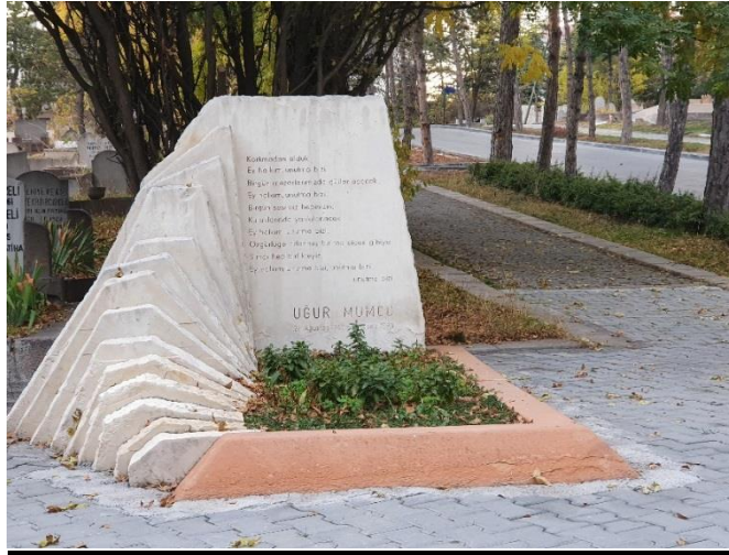
Uğur Mumcu'nun Cebeci Asri Mezarlığı'ndaki anıt mezarı.

biçimde öldürölüp, bu durum toplumsal bellekte bu kadar güçlü yer edinmeseydi, ayrıca patlamanın olduğu yere böylesi bir anıt inşa edilmeseydi, bu sefer, başka örneklerde olduğu gibi, mezarın anma etkinliklerinin merkezi haline gelmesi söz konusu olabilirdi. Ancak inşa edilen anıt sayesinde mezarın, siyasi ağırlıklı anmaların merkezi olmaktan görece uzak kaldığı ifade edilebilir.