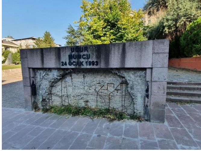
Uğur Mumcu için yapılan anıtın bir başka yönden görüntüsü. Patlamanın yarattığı tahribat anıtta korunmuş.