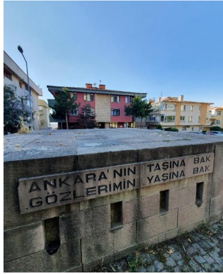
Uğur Mumcu'nun öldürüldüğü noktaya yapılan anıt. Arka planda Mumcu'nun yaşadığı evin olduğu, (sarı renkli) bina.