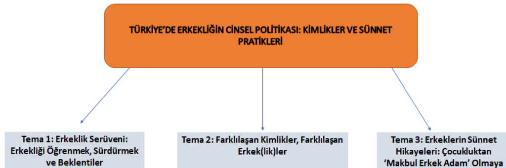
Görsel 3: Tematik Analiz Tablosu

DeVault'un ifade ettiği noktalardan yola çıkarak feminist tematik analiz yaparken Corbin ve Strauss'un (2008) ifade ettiği gibi açık kodlama (open-coding) yaptım. Yani, öncelikle satır satır (cümle cümle/ line by line) kodlamalar yaptım. Bu işlemi araştırmaya katılan 20 kişinin dökümüne sırasıyla uyguladım. Ardından benzer içeriğe sahip kodları bir çatı altında toplayıp farklılıkları göz ardı etmeyecek şekilde yeniden kodladım. Ardından, bu yeni kodların benzer olanlarını bir araya getirerek alt kategorileri elde ettim. Son olarak da benzer kategorileri bir araya getirerek temaları oluşturdum. Temaları elde ettiğimde içeriklerine tekrar bakıp alanyazın ile eş zamanlı olarak değerlendirdim ve ardından son halini oluşturdum. Aşağıdaki Görsel 3'de temalar görülmektedir: