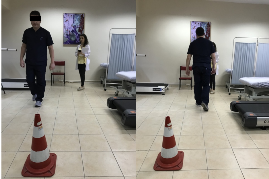
Şekil 3.1. Süreli kalk yürü testi

Süreli kalk yürü testi; Süreli kalk yürü testinde (SKYT) katılımcılar teste başlamadan önce 43 cm yükseklikteki standart bir sandalyeye sırtını yaslayarak oturdu. Katılımcı, daha sonra ayağa kalktı ve uzunluğu önceden hesaplanmış 3 metrelik mesafeyi düzenli adımlarla yürüdü, geri döndü ve sandalyeye tekrar oturdu. Katılımcının SKYT sırasındaki yürüme zamanı kronometre yardımıyla saniye cinsinden kaydedildi. SKYT, 1 dakika arayla iki defa uygulandı ve en iyi süre saniye cinsinden kaydedildi (125) (Şekil 3.1.).