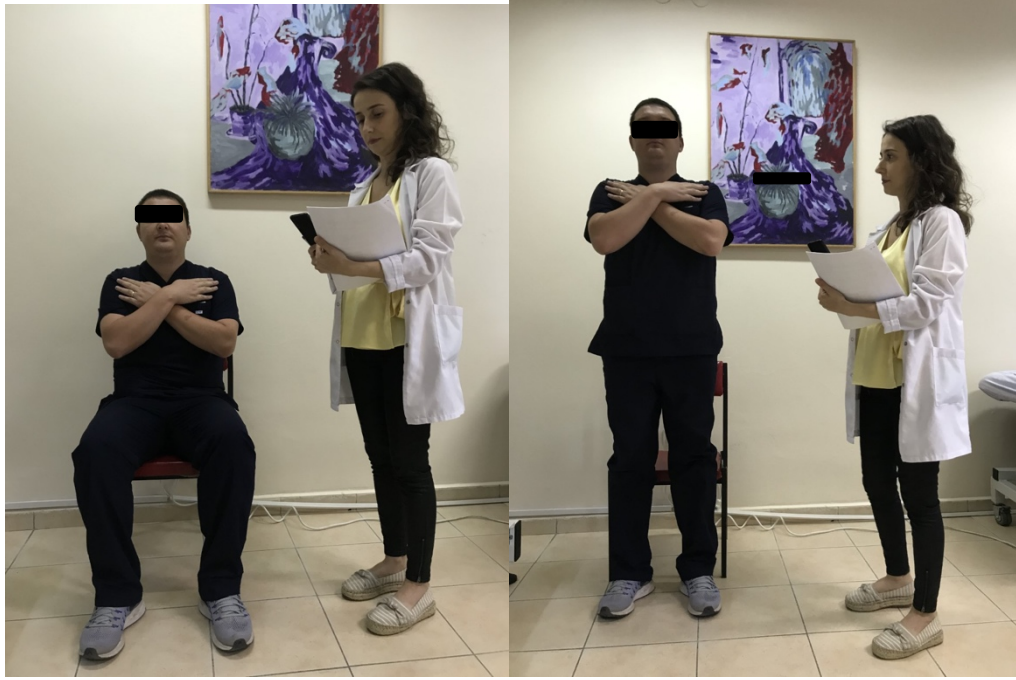
Şekil 3.2. 1 dakika otur kalk testi