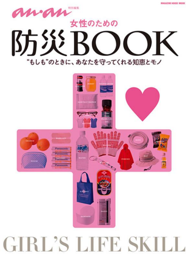
Şekil 2. Japonya'da kadınlar tarafından hazırlanan afete hazırlık broşürü

sırasında çadırda yatma, su ve elektrik olmadan idare edebilme ve bunun gibi konularda bilgi vermişlerdir.(Koikari, 2013) Ayrıca, çocukların afetler konusunda bilinçlendirilmesine yönelik olarak çeşitli merkezlerde (üniversitelerde ya da yerel yönetimlerde) eğitim araçları hazırlamışlardır. Bunlar arasında çocukları sevdiği geleneksel oyunlar ya da popüler animasyon karakterleri kullanılarak çocukların afete hazırlık ve afetleri önleme konusunda bilinçlendirilme faaliyetleri de yer almıştır. (Şekil 2) (Koikari, 2013).