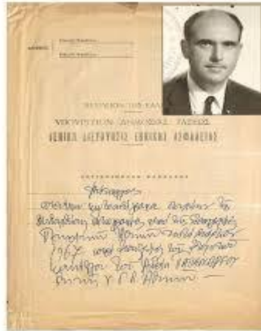
Andreas Papandreou'nun Gizli Dosyası