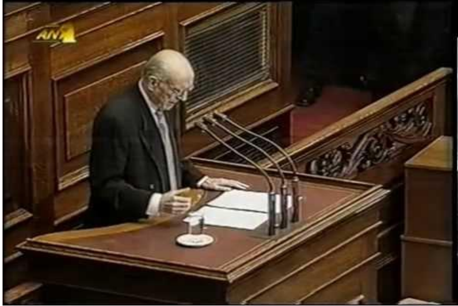
Andreas Papandreu 1994'de Parlamento K rs s nde