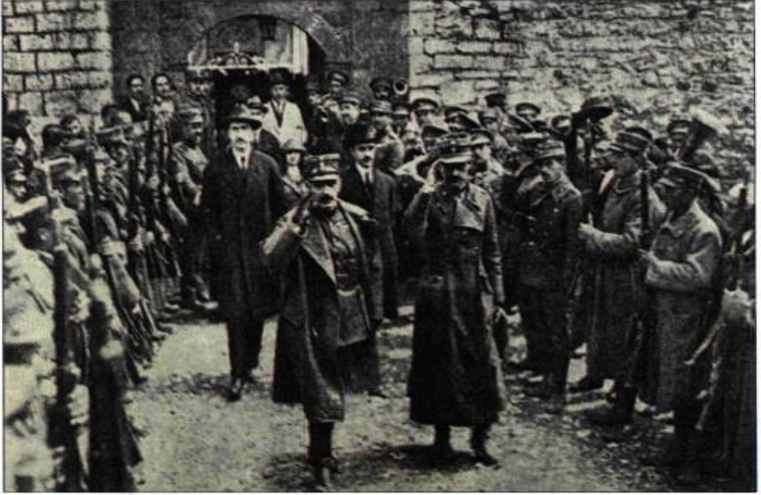
1922 Askerî Hareketinin Liderliđi