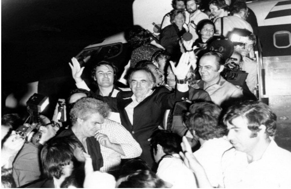
1974'de Andreas Papandreou'nun Yunanistan'a Dönüşü