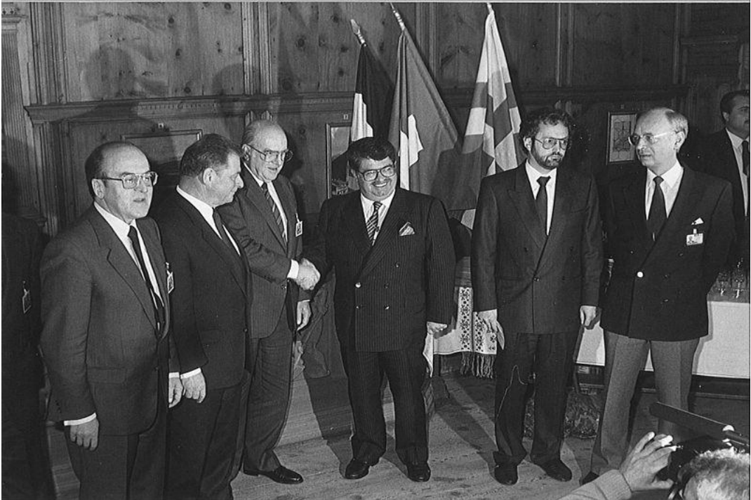
Andreas Papandreou 1988'de Türk Başbakan Turgut Özal ile Davos'ta.