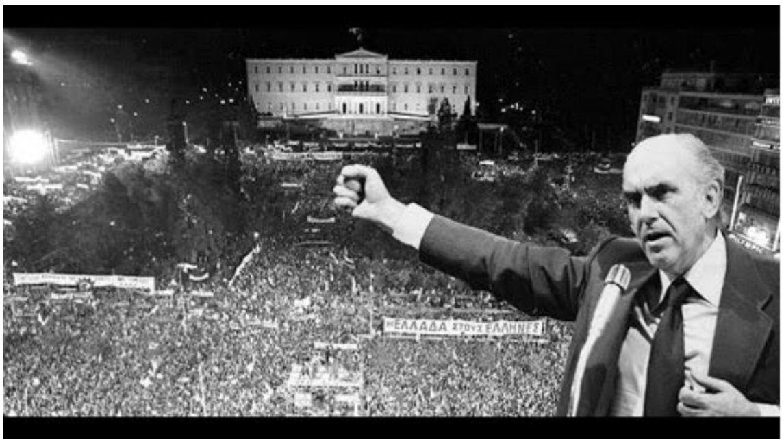
PASOK İktidarda, 18 Ekim 1981.