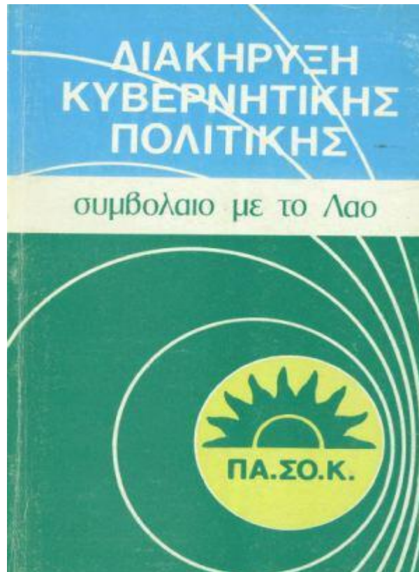
Halkla Sözleşme, 1981