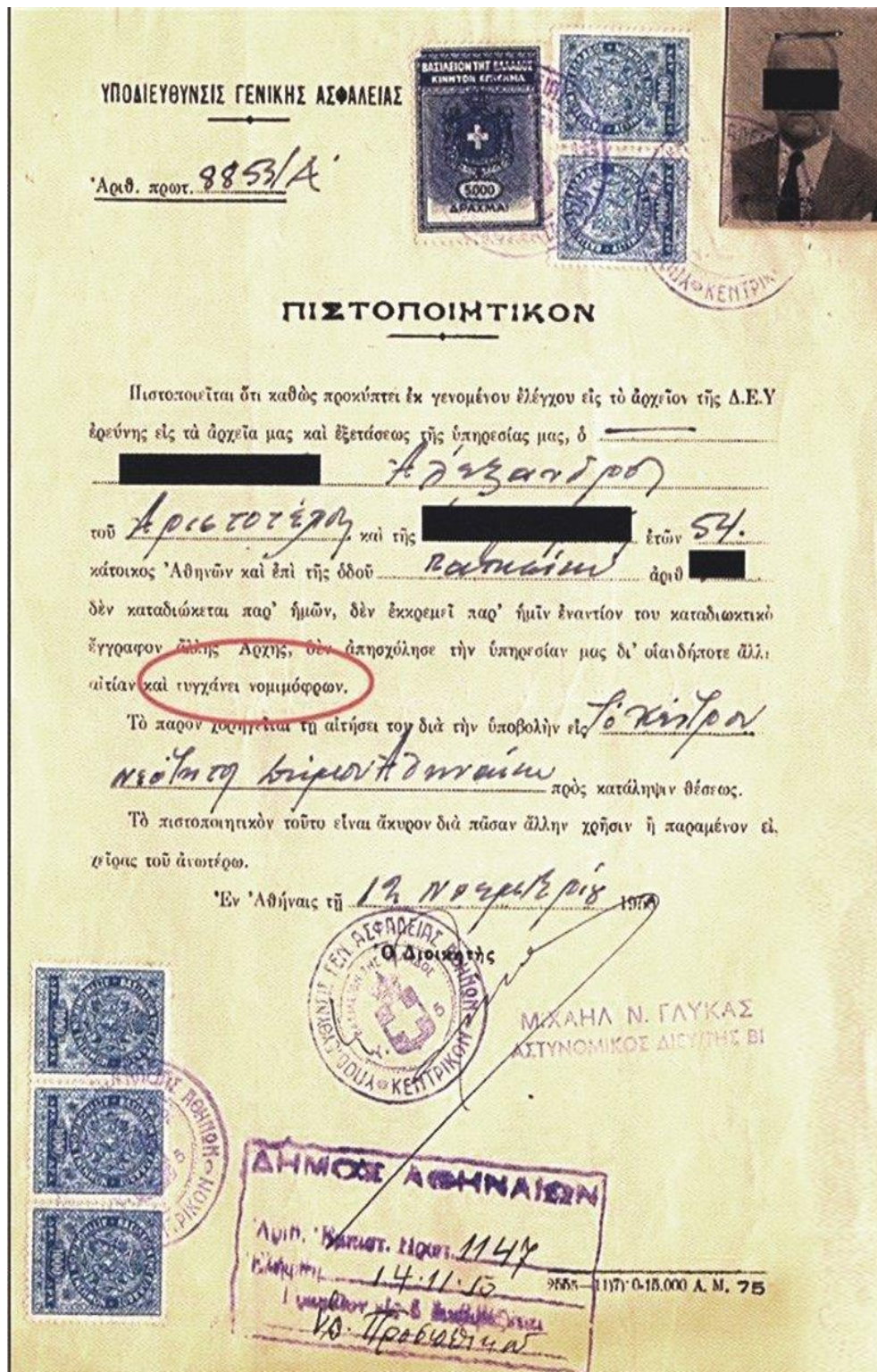
Toplumsal Düşünce Belgesi