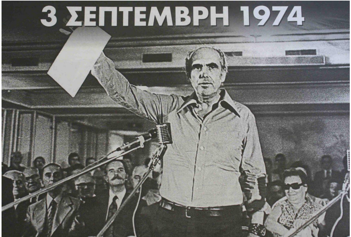
PASOK'un Kuruluşunun İlanı, 3 Eylül 1974.