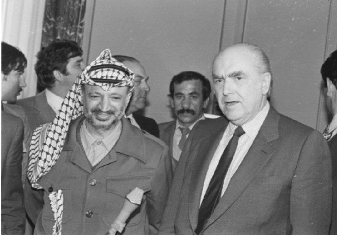
Andreas Papandreou Yaser Arafat ile.