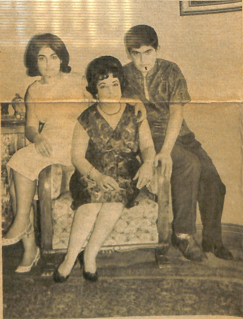
İKİ ÇOCUĞU İLE — Sanatkar çocuklarına çok düşkündür; ideali onları iyi yetiştirmek.

S — «Boş vakitlerinizi nasıl geçirirsiniz?»