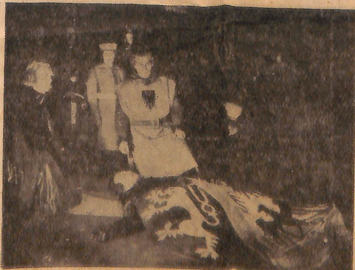
1945 de bombalanan Burg Tiyatrosu 10 sene sonra 1955 de König Ottokars Gluck ve Ende (Kral Ottokars Saadetli ve Sonu) piyesinde oynamışlardır. Resim piyesten bir sahneyi gösteriyor.