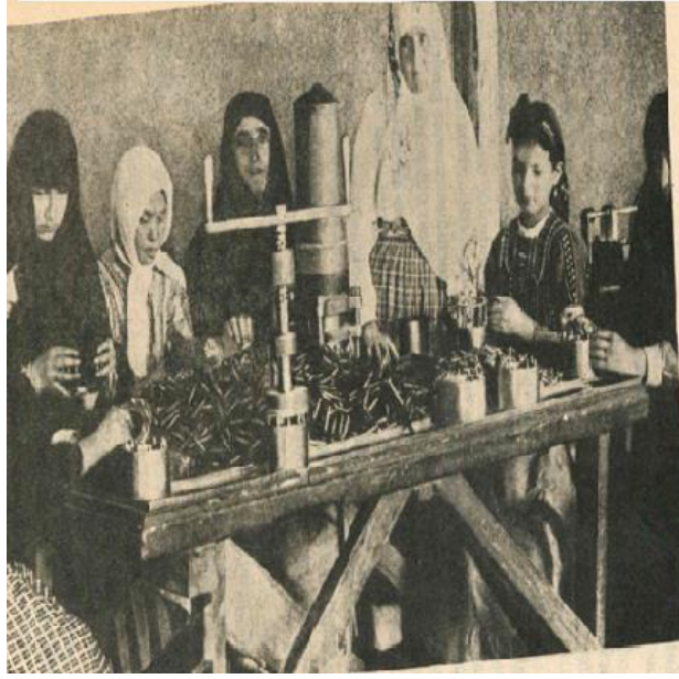
Resim 4: Türk Kadını Cephane İmalinde 148

Mustafa Necati “İstiklal Mücadelesi Hatıraları” yazı dizisinde Kurtuluş savaşı sırasında rastladığı bir olayı şöyle anlatır: