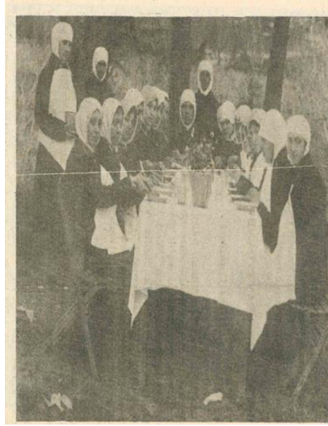
Resim 2: Kadınlar Birinci İşçi Taburu 143

Tüm bunlar Birinci Kadın İşçi Taburu'nun ortaya çıkmasına sebep olmuştur. Kadın işçi taburuna alınacak kadınların belirlenmesi için Kadınları Çalıştırma Cemiyeti İslamiyesi ile ortak çalışmışlardır. Bu cemiyet 1916 yılında kurulmuş, eşini kaybeden kadınların iş bulmalarına ve evlenme yaşı gelen kadınların evlendirilmesine yardımcı olmuştur. Aile kurumuna önem vermiş, üyelerinin evlendirilmesi için çaba sarf etmiştir. Ayrıca 21 yaşına geldiği halde evlenmeyenlerin cemiyetle ilişkisi kesilmiştir. Kimsesiz çocuklar ve kadınların barınması için kalacak yer tahsis etmişlerdir. İstanbul dışında Anadolu'da da şubeler açan dernek 1918'de Kamu Yararına Çalışan Dernekler arasına girmiştir. İş sahibi olan kadınlardan %10 aidat olarak faaliyetlerini sürdürmüştür. 144