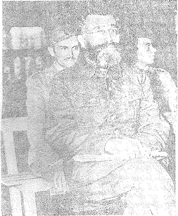
Kurşuna dizilen General Draja Mihailoviç muhakemesi esnasında

Mihailoviç, ilk müdafaaasında cesur hareket etmiştir. Hadiseleri olduğu gibi açıklanış ve Çörekli bu işlerden mes'ul bile olmamıştır. Verdiği hadelerden birinde Tito'ya da hücum etmiş ve onu korkaklıkla itham etmiştir. Almanlarla mücadeleyle başladığından, yakalandığı 1946 senesinin Mart ayına kadar hiç bir zaman vatanından, en tehlikeli ve ümitsiz anlarda bile, ayrılmadığını anlatan Mihailoviç, buna mukabil, işgal devrelerinde, Tito'nun Moskovada emniyette bulunduğunu, ancak mücadelenin Almanlar aleyhine dönmeğe başladığı zaman Yugoslavyaya indiğini, hatta karar-