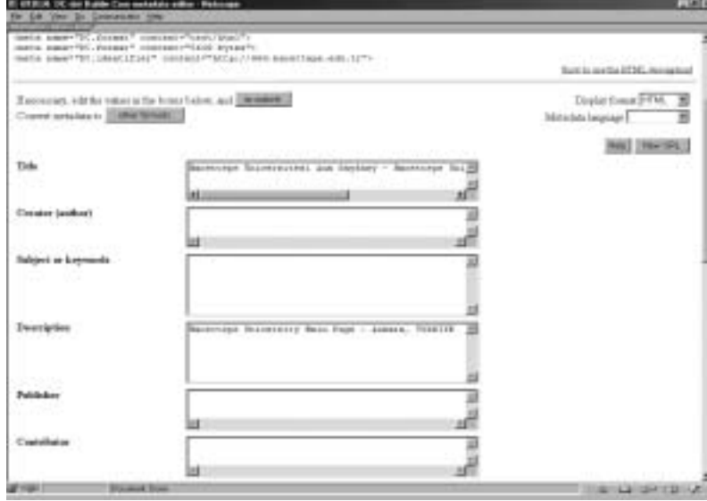
Şekil 5. DC-dot üst veri yaratıcısının arayüzü