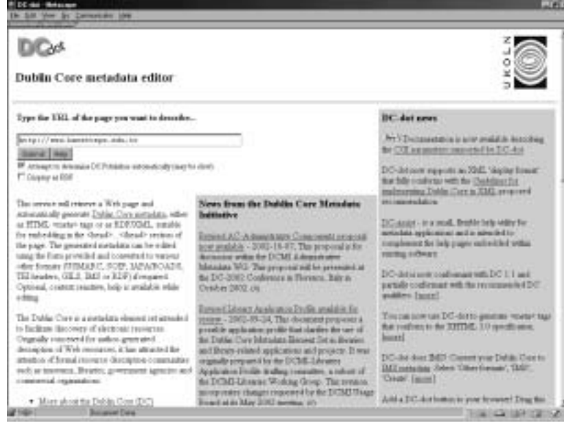
Şekil 4. DC-dot'un Web sitesi

Belge ile ilgili yaratılan üst veri üzerinde de değişiklikler yapmak olanaklıdır. Örnek vermek amacıyla Hacettepe Üniversitesi Web sitesinin DC-dot aracılığıyla üst verisi oluşturulmaya çalışılmıştır (bkz. Şekil 4 ve Şekil 5). Görüldüğü üzere başlık ve tanım alanları belgeden alınarak görüntülenmiş, yaratıcı, konu ve anahtar kelimeler gibi kısımlar ise içi boş bir şekilde gelmiştir. Boşlukların uygun ifadelerle doldurulmasıyla sitenin üst verisinin oluşturulması mümkündür. DC-dot üst veri yaratıcısı HTML, XHTML, RDF, XML gibi farklı görüntüleme formatları sunmaktadır. Söz konusu farklı görüntüleme formatlarının yanı sıra farklı dil seçenekleri de verilmektedir. Bu diller İngilizce, Fransızca, Almanca, İtalyanca, Portekizce ve İspanyolca'dır. Ayrıca DC-dot aracılığıyla elde edilen üst verileri farklı formatlara dönüştürme işlemi de gerçekleştirilebilmektedir. Söz konusu formatlar, RDF, kısaltılmış RDF, IMS, HTML text, US-MARC, Özet Nesne Değişim Formatı (Summary Object Interchange Format-SOIF), TEI başlıkları, IAFA/ROADS, GILS ve XML'dir (Powell 2000).