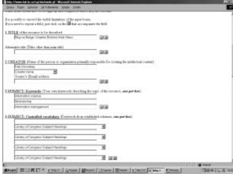
Şekil 2. Nordic Web Index DC Metadata Template arayüz görüntüsü