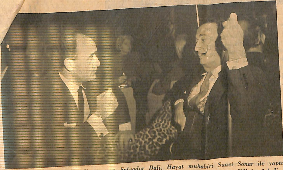
Ünlü sürrealist ressam Salvador Dali, Hayat muhabiri Suavi Sonar ile yaptığı görüşme sırasında Türkiye'yi ne zamandır görmek istediğini söyledi...

O NA merak ve şaşkınlıkla bakıyordum. Hiç tereddüt etmeden söyleyebilirim ki, şimdiye kadar dünyada gördüğüm ünlü kişiler arasında beni en çok şaşırtanı oydu.