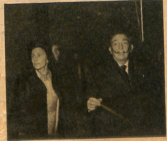
Karı-koca Dalí'ler muhabirimizle yaptıkları görüşmeden çıkıyorlar...

Benden Türkiye hakkında bilgi alırken, karısı da hazırlanmış olarak geldi. Gerçekten hoş ve alımlı bir kadın. Bej renge vizondan mantosunun altında koyu zemin üzerine lame bir tuvalet giymişti. Davete beni de götürmek istediler, özür diledim. Ayrılırken, Salvador Dalí elimi hararetle sıktı ve sanat inancısını şöyle açıkladı: «Hayatta üç önemli şey var: Cinsî arzu, cinsî cazibe ve ölüm duygusu. Bu üç şey sanatın, heyecanların ve aşkın esasıdır.»