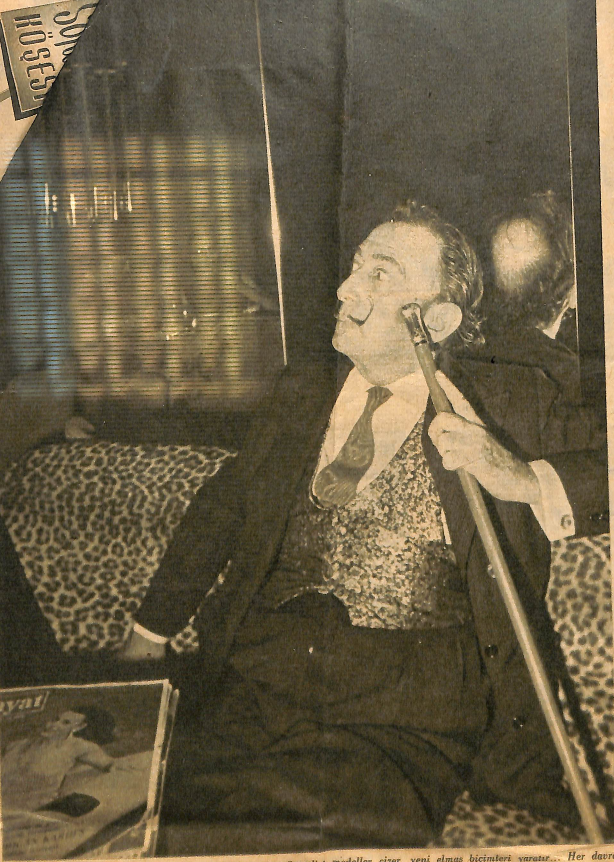
Dalı resim yapar, film çevirir, modacılar için sürrealist modeller çizer, yeni elmas biçimleri yaratır... Her davranışında bir acayiplik görürsünüz. Fakat her şeye rağmen tekniği son derece kuvvetli olan gerçek bir ressamdır.