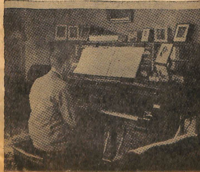
PIANOSUNUN BAŞINDA — Rachmaninoff çok sevdiği müziğe dalmış durumda görülüyor.