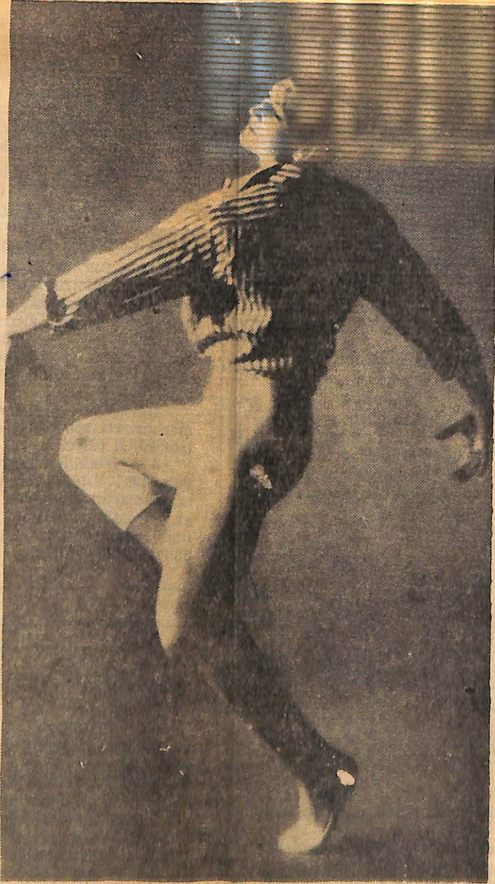
DAVID BLAIR — Dünyanın en iyi dansörlerinden biri olarak kabul edilen Blair bugünkü haline gelebilmek için insan üstü bir çalışma gücü göstermiştir. Onun bu başarısında bu şekilde çalışmasının ve baleyi çok sevmenin rolü büyüktür.

Jascha Heifetz Amerika'daki ilk konserini veriyordu. Koskoca Carnegi Hall konser salonu bu genç ke mancıyı dinliyebilmek için gelen müzik severlere tarafından hinca hin doldurulmuştu. Ünlü pianist Rubinstein ile Violonist Mişha Elman da dinleyiciler arasındaydı. Heifetz, akıllara durgunluk veren tekniğiyle bütün herkesi büyülediği bir sırada, Mişha Elman sıkıntıyla yanındaki koltukta rahat rahat oturan Rubinstaine döner: «Öf, hava ne kadar sıcak değil mi?» dedi Rubinstein mütebessim cevap verdi. «Pianistler için değil.»