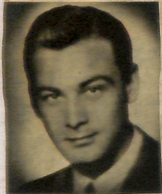
YIL 1945 — Şişli ve Nişantaşı Ortaokullarının müzik öğretmeni.