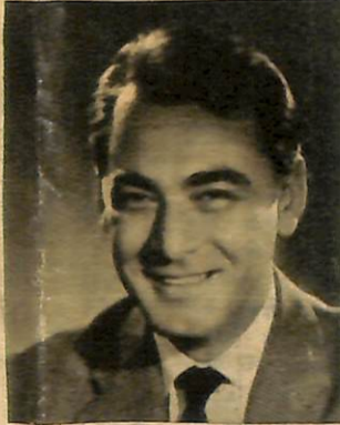
YIL 1956 — Amerika'ya gitmek üzereyken bu fotoğrafı çekti.