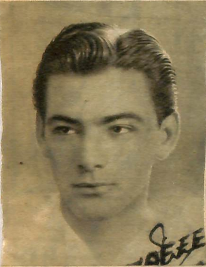
YIL 1940 — Ankara Devlet Konservatuvarına girdiği ilk yılda çekilen hatıra fotoğraflarından biri.