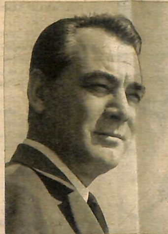
YIL 1967 — Beşiktaş Hayrettin İskelesinde «çocukluk günlerine» bakıyor. Aradan 40 yıl geçmiş, eski mahallesi çok değişmiştir, ama Tema bunca yıl değişmemiş.