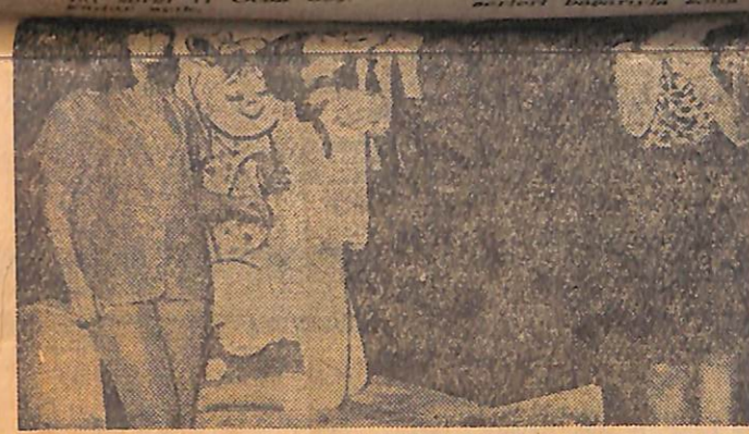
Oraloğlu Tiyatrosu, Alev Oraloğlu'nun baş rolünü oynadığı «Noktacı» oyununu oynuyor. Fotograf, Ayten Güvenc, Alev Oraloğlu, Erdoğan Tuncel ve Dikmen Gürün'ü göstermektedir.

Yıldız Dağdelen, 4 Ocak 1967 Çarşamba günü saat 18,30 da piyanist Ergican Saydam eşliğinde Türk - Alman Kültür Merkezinde bir konser verecek.