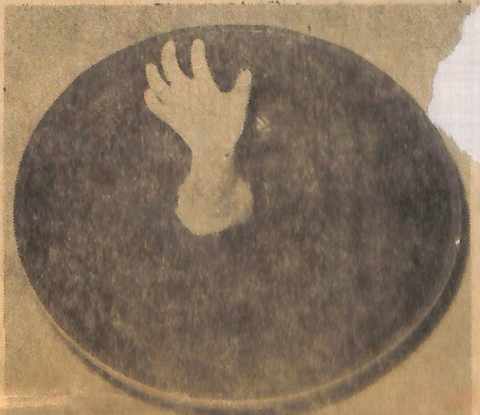
Denize düşmüş bir adam, yardım bekliyor sizlerden.. Ne var ki, siz deniz kıyısında falan değilsiniz. Steacık odanızdasınız. İyi bir rihtli imdat isteyen meçhul kişi de aynı odada.. Yanbaşınızda duran bir tabağın içinden fırlamış eli bu kişinin.. Semih Balcıoğlu'nun seramikte yaptığı 40 karikatürden biri de bu..