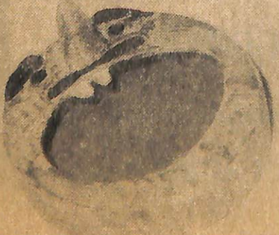
Olur olmaz şeye açılan, geveze, konuşmaya, öfkelenmeye hazır bir ağız. Hiç kapandığı yok.. Balcıoğlu ona bir azizlik yapmış, usta elleriyle bir küllük haline getirmiş onu.. Şimdi hep açık kalabilir bu ağız.. Öfkemin, gevezeliğin yerini nükte almıştır artık...