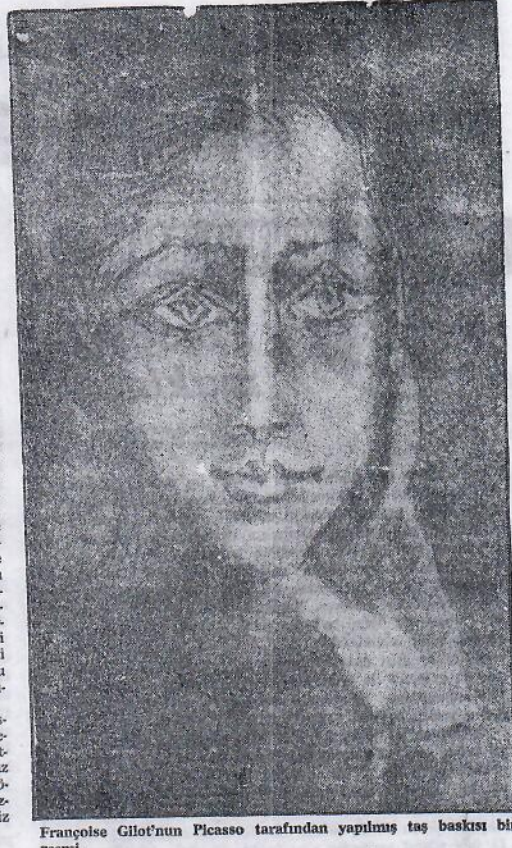
Françoise Gilot'un Picasso tarafından yapılmış taş baskısı bir resmi.

Haziran sonuna doğru bir sabah, bana «Orman»ın nişini göstermek istediğini söyledi. Bu deyim ile Fransızca, damların birbirleriyle bitirdiği kırışık yukarıdan ba-