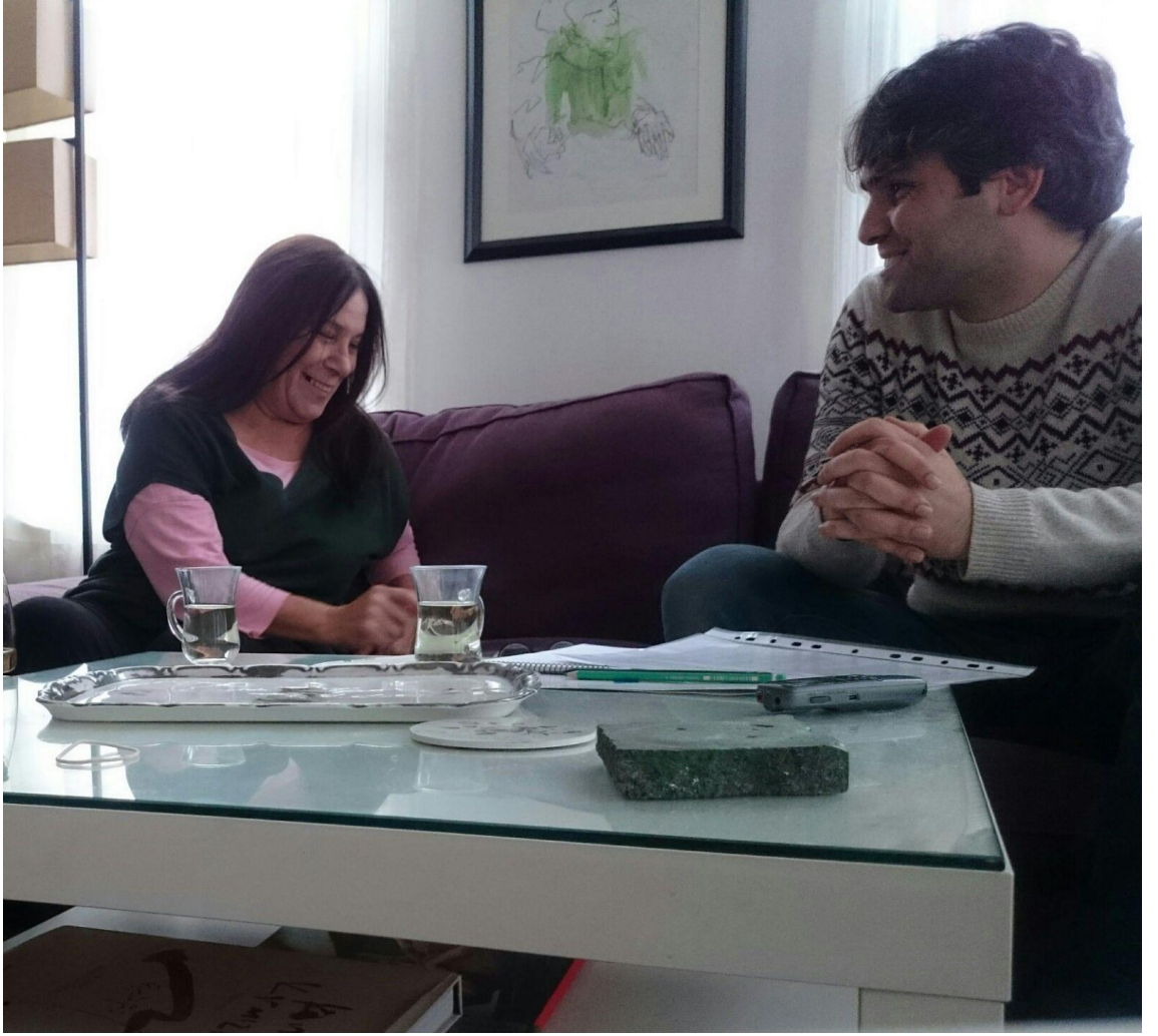
(16 Ocak 2018, İstanbul, Arnavutköy)