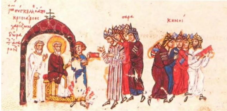
Ioannes Synkellos'un Müslümanlara hediyeler vermesi: Madrid Skylitzes Fol. 47v.