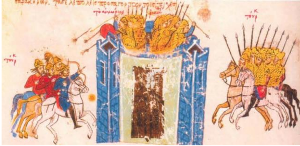
Amorion'un Müslümanlar tarafından kuşatılması: Madrid Skylitzes Fol. 58v.