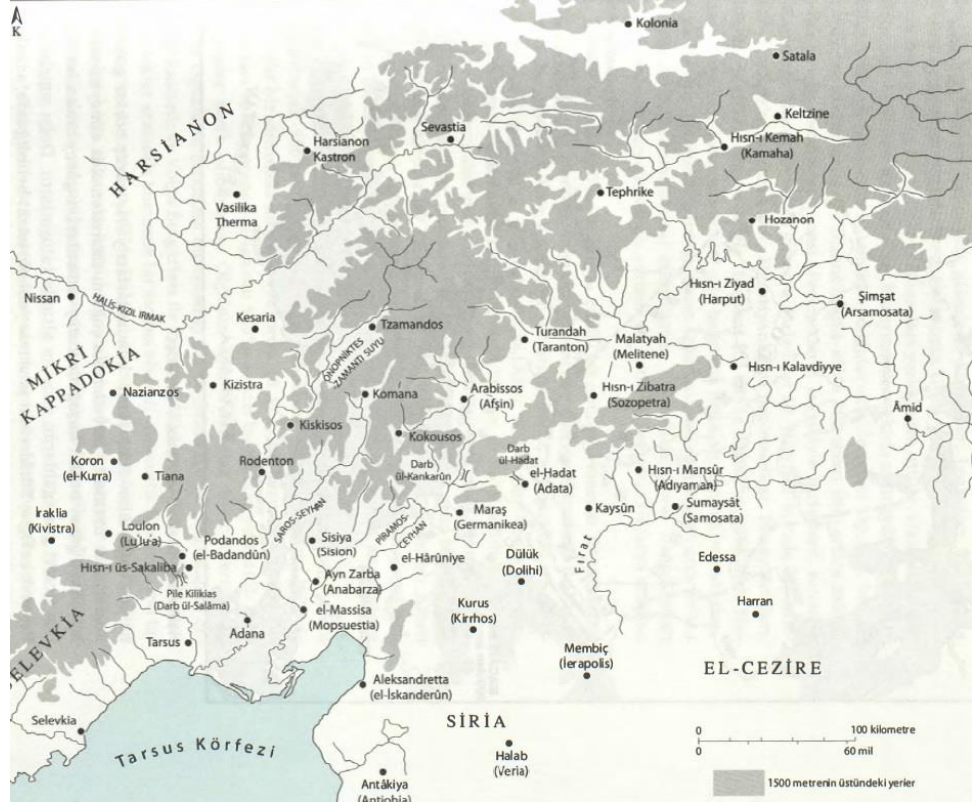
700-950 yıllarında Bizans İmparatorluğu'nun doğu sınırı: John Haldon, Bizans Tarih Atlası , çev. Ali Özdamar, Alfa Yayınları, İstanbul 2017, Harita 8.8.