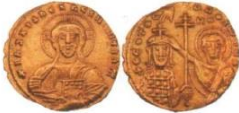
I. Ioannes Tzimiskes dönemi (969-976) Histamenon nomisma 'sında Hz. Meryem imparatora taç giydirmekte: Ceren Ünal, Bizans Sikkelerinde Kutsal Kişi Tasvirleri , TTK Yayınları, Ankara 2020, s. 75.