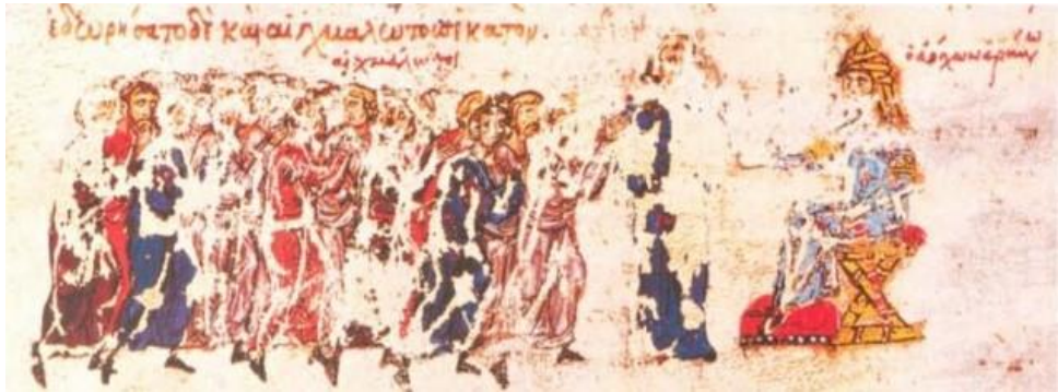
Müslüman emirin Bizanslı tutsakları serbest bırakması: Madrid Skylitzes Fol. 47v.