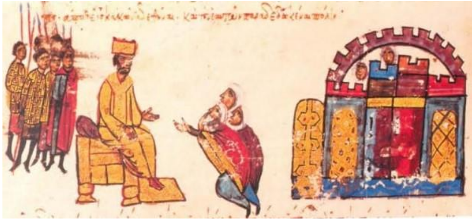
II. Nikephoras Phokas'ın huzuruna çıkan Tarsus elçileri: Madrid Skylitzes Fol. 151v.