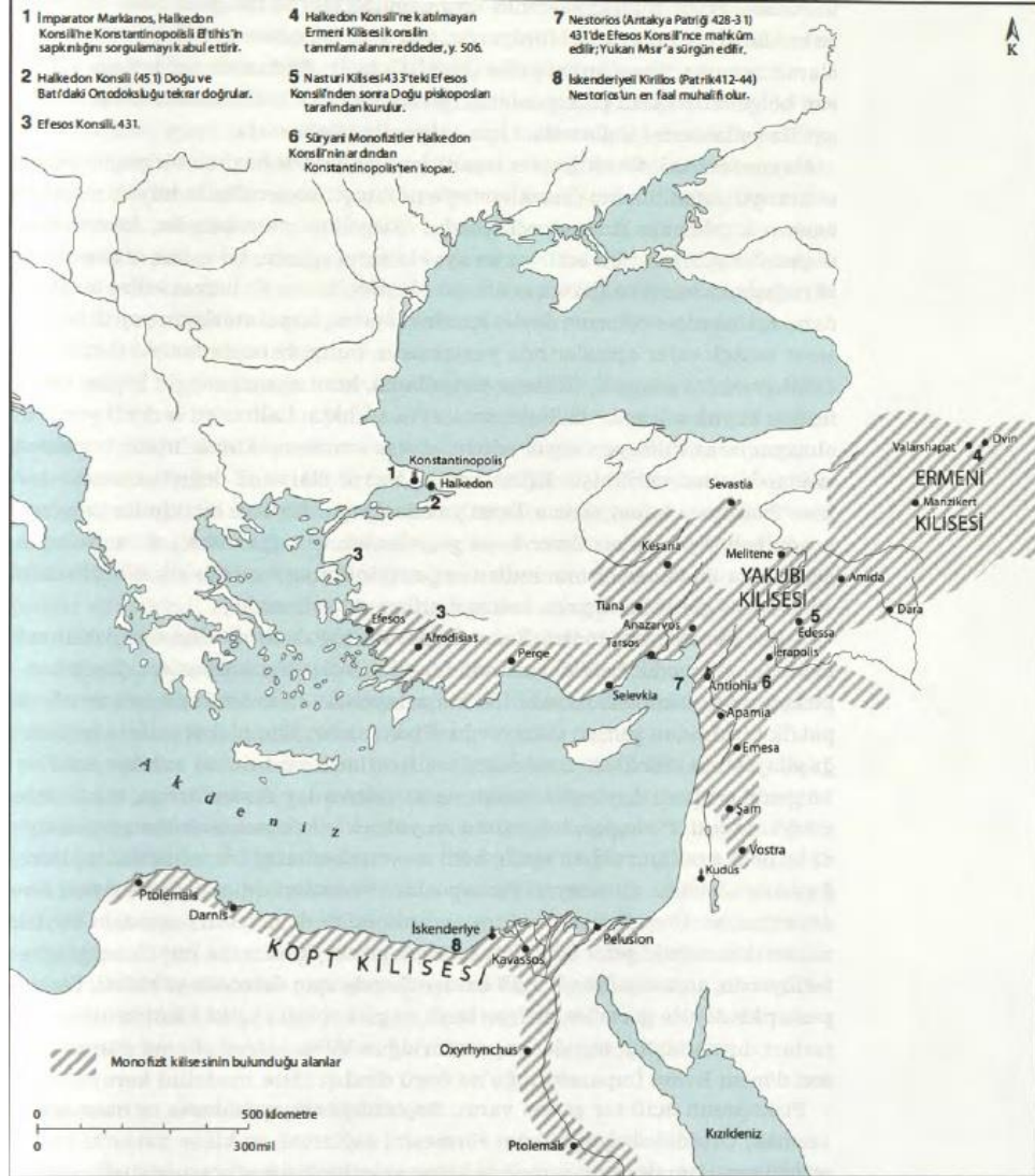
V.-VI. yüzyıllarda imparatorlukta Monofizitler ve “sapkın” kiliseler: John Haldon, Bizans Tarih Atlası , çev. Ali Özdamar, Alfa Yayınları, İstanbul 2017, Harita 4.2.