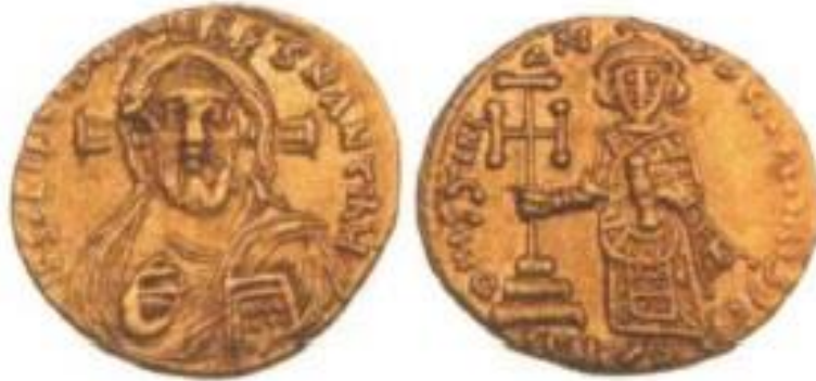
II. Iustinianos'un ilk döneminde (685-695) basılan solidus 'ta Hz. İsa: Ceren Ünal, Bizans Sikkelerinde Kutsal Kişi Tasvirleri , TTK Yayınları, Ankara 2020, s. 28.