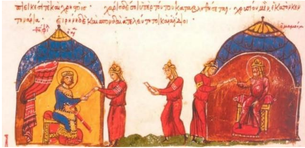
Halife Me'mûn'un İmparator Theophilos'a gönderdiği elçi: Madrid Skylitzes Fol. 75v.