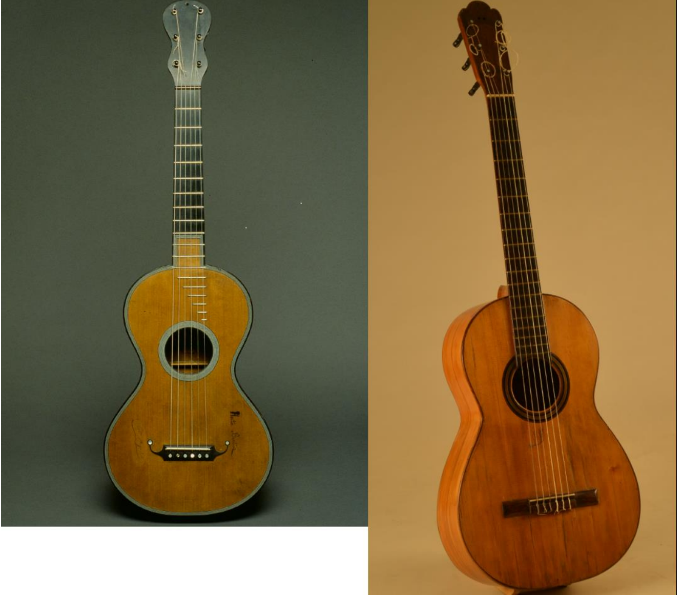
Görsel 2. Romantik Gitar(Solda) ve Torres Gitarı(Sağda)

Tarrega'nın çabaları Avrupa'da gitar dünyasını büyük ölçüde etkilemiştir. Tarrega'nın öğrencileri, Llobet, Daniel Fortea ve Emilip Pujol Tarrega'nın öğretme metodunu Avrupa ve Amerika'da kullanmışlardır. Tarrega'nın etkisi daha sonra 1920'lerde uluslararası konser turuyla ünlüen Andres Segovia'ya kadar ulaşmıştır. İlk gitar okulunun limitli repertuarı karşısında Segovia, içinde Johann Sebastian Bach, Felix Mendelssohn, Robert Schumann, Isaac Albeniz, Enrique Granados ve Ludwig Van Beethoven gibi bestecilerin eserlerini gitara uyarlamıştır. Belki de Segovia'nın gitar repertuarına en büyük katkısı 20. yüzyıl bestecilerini gitar için