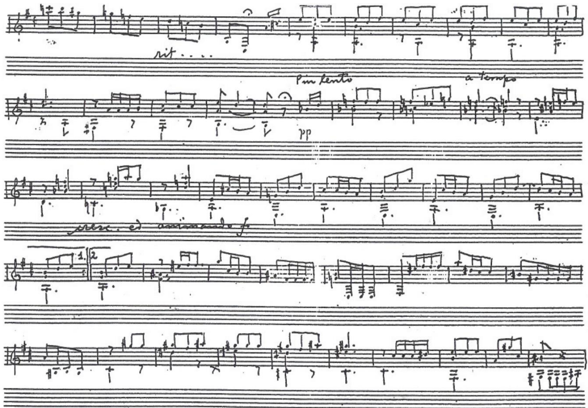
Görsel 15. Ponce M. Sonatina Meridional el yazması

Mektubun devamında Segovia Ponce'ye bestelediği sonatı, Segovia gelene kadar bitirmesini aksi halde çok ciddi şekilde kavga edeceklerini, belki de esprili bir biçimde, belirtmiştir.