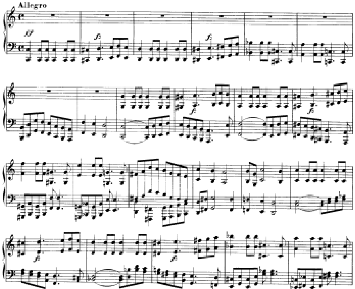
Görsel 33: Dördüncü Bölüm 598-620. Ölçüler (Verlag, 1974, s. 26)

bir bölme ile başlamaktadır. Wanderer Fantasy'nin dördüncü bölümü, hızlı ardışık oktavlar, arpejli motifler, tremolo figürleri ve iki el arasında sürekli yer değiştiren pasajlardan oluşan son derece ustalık gerektiren bir bölümdür. Dördüncü bölüm, sol elde basta, oktav şekilde 598-605. Ölçüler arasında gelen temanın duyurulması ile f ' biçimde başlamaktadır. İlk tema sekiz ölçü olarak sunulmaktadır. Tema sonrasında 606. Ölçüde alto partisinde karşıt temayla birlikte karşımıza çıkmaktadır. Bu temanın ikinci duyuluşu bir uzatma ölçüsü ile karşımıza gelip, diğer temaların aksine dokuz ölçüdür. Temanın üçüncü gelişi soprano partisinde ve dördüncü girişi ise tekrar bas partisinde duyulmaktadır. İlk sunumdan itibaren ses aralıkları arttırılarak ses hacmi genişletilmiştir. Böylece zaten kuvvetli başlayan bölümün ihtişamı gittikçe artmaktadır. Açılış bölümünün tamamı, temanın her gelişiyle kademeli bir gerilim artışı yaratır.