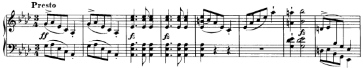
Görsel 25: Üçüncü bölüm, 245-252. Ölçüler (IMSLP, https://s9.imslp.org/files/imglnks/usimg/4/4e/IMSLP53591-PMLP86693-Schubert_Werke_Breitkopf_Serie_11_No_108_Op_15.pdf )

Bölümde, tıpkı birinci bölümdeki gibi, açılış teması “ ff ” olarak karşımıza çıkmakta ve coşkuyla gelinen bir puandorg ile sunum tamamlanmaktadır. İkinci kez bu açılış teması “ pp ” olarak görülmektedir.