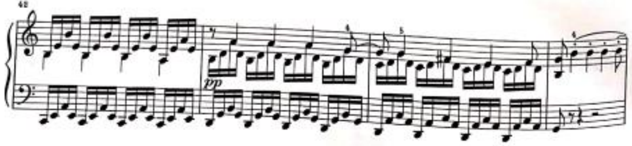
Görsel 4: Birinci Bölüm, 42-45. Ölçüler (Verlag, 1974, s. 2)

45. ölçüden itibaren bağlayıcı bir köprü ortaya çıkmaktadır. 47. Ölçüde bu köprünün içerisinde açılışta duyduğumuz ritmik kalıp bu sefer Mi Majör tonunda ve çeşitlenmiş biçimde görülmektedir. Daha sakin bir dokuya ve sıcak bir melodik çizgiye sahip olan bu bölümle birlikte müziğin gerilimi kısa bir süreliğine hafifletilse dahi, 67. Ölçüde başlayan Do Majör tonundaki tremololar ile gerilim tekrar yükselmekte ve bağlayıcı köprü müziği sergi bölmesindeki temaya taşımaktadır.