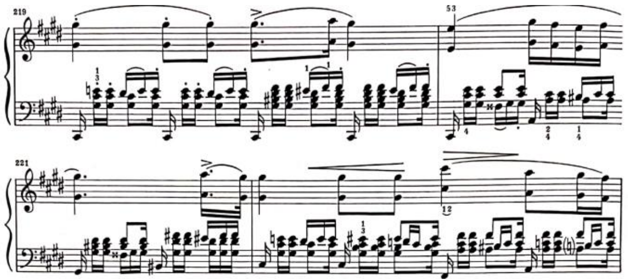
Görsel 19: İkinci Bölüm, 219-222. Ölçüler (Verlag, 1974, s. 12)

Bu iç ısıtan liriklikteki varyasyonun hemen ardından 219. Ölçüde do diyez minör tonalitesinde ‘üçüncü varyasyon’ gelmektedir. Bu varyasyon bir öncekine göre çok daha dramatik bir yapıdadır. Sol elde duyulan üçleme akorların üstünde tema sağ elde oktav olarak sunulmaktadır. Sağ elde gelen temanın yanı sıra sol elde armoni değişimleriyle beraber bir çizgi gözlemlenmektedir. Bu çizgide gelen ikili aralıklar dramatik havayı destekleyici olmaktadır.