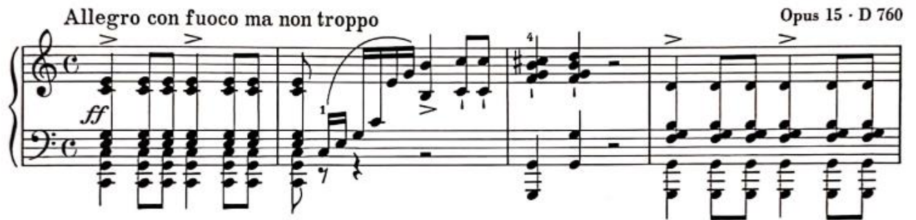
Görsel 2: Birinci Bölüm, 1-4. Ölçüler (Verlag, 1974, s. 1)

Fantezinin birinci bölümü, Allegro con fuoco ma non troppo başlığında ve Do Majör tonundadır. Bölüm, daha sonra dördüncü bölümde tekrar hissedilen kahramanca bir ruha sahiptir. Bu bölüm, sonat formuna benzer öğeler barındırıyor olmasına rağmen, sonat formunu katı bir şekilde takip etmez (HENGYUE, 2020). İlk bölüm bütün fantezi boyunca sıkça karşımıza çıkacak olan ritmik yapıyı ‘ ff ’ şekilde, Do Majör tonundaki akorlar ile sunarak başlamaktadır. Bu görkemli açılış bize eserin genel havası hakkında önemli ipuçları vermektedir.