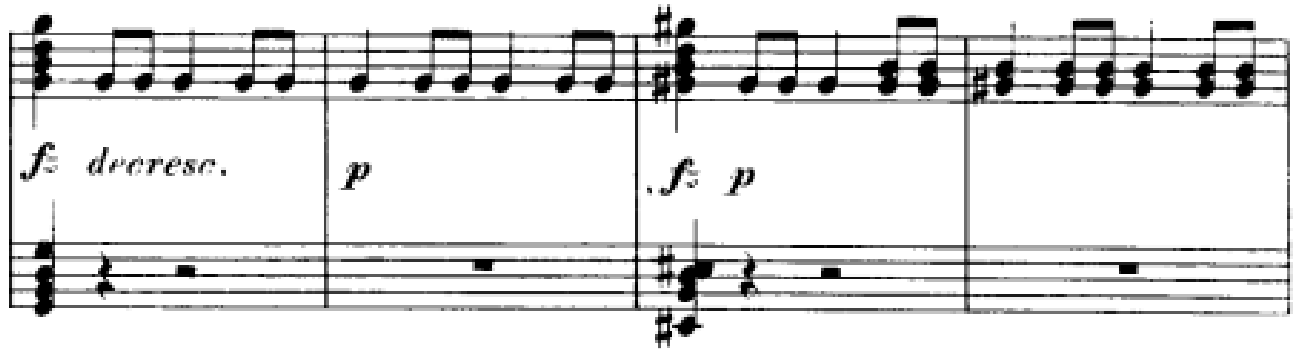
Görsel 12: Birinci Bölüm, 165-168. Ölçüler (Verlag, 1974, s. 8)

Ardından bu görkemli bölme 165. Ölçüde yine ani bir şekilde Do Majör tonalitesinin dominantı olan Sol Majör ile kesintiye uğrar ve bizi Adagio (ikinci bölüm) bölümüne taşıyacak olan gelişme bölmesi başlamaktadır. Dolayısıyla 167. Ölçüde Adagio bölümünün tonalitesi olan do diyez minörün dominantını duyurarak dalgalı ve ffz akorlar ile kesintiye uğrayacak olan sakin bölme başlamaktadır.