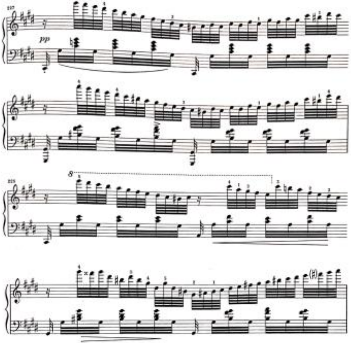
Görsel 21: İkinci Bölüm 227-229. Ölçüler (Verlag, 1974, s. 13)

altmışdörtlük notaların altında, sol el akorlarının üst sesi ile tema anımsatılmaktadır. Hem dinamik hem lirik olan bu bölme, ikinci bölümün zirve pasajlarına müziği taşımaktadır.