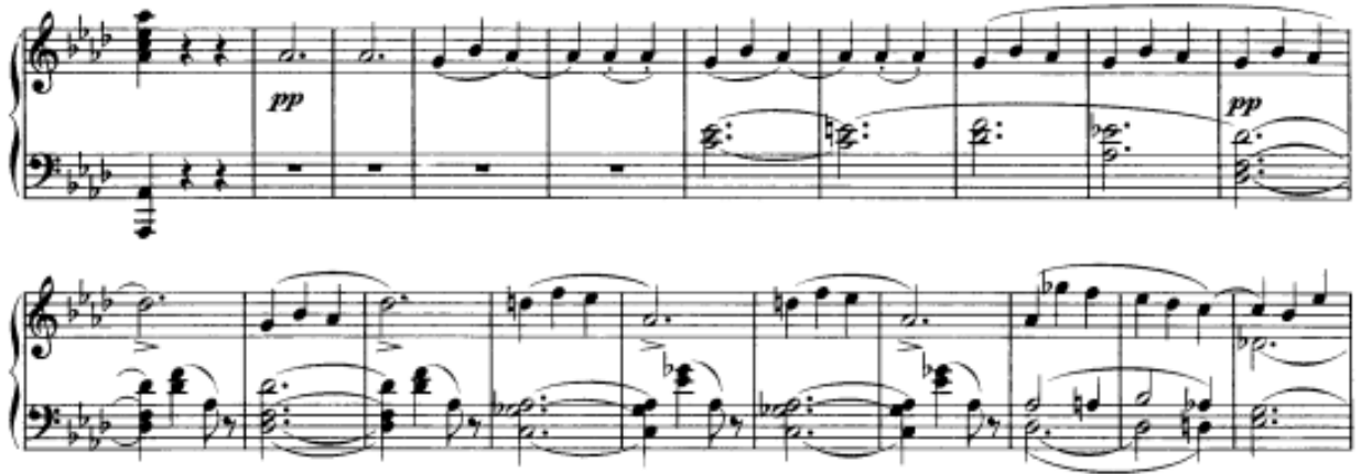
Görsel 29: Üçüncü Bölüm, 423-44. Ölçüler (Verlag, 1974, s. 22)

Yine La bemol Majör tonunda gelen ‘C’ teması, yani üçüncü tema, oldukça dingin bir yapıya sahiptir. Öncesinde ve sonrasında gelen hareketli pasajların aksine bu dingin müzik ile atmosfer görkemli kodadan önce sakinleşmektedir. Tema önce tek sesli sonra altılı aralıkların üst sesi aracılığıyla ve en sonda da oktav olarak sağ elde sunulmaktadır.