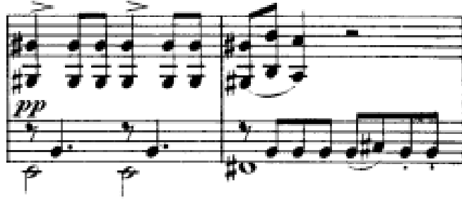
Görsel 5: Birinci Bölüm, 47-48. Ölçüler (Verlag, 1974, s. 3)

45. ölçüden itibaren bağlayıcı bir köprü ortaya çıkmaktadır. 47. Ölçüde bu köprünün içerisinde açılışta duyduğumuz ritmik kalıp bu sefer Mi Majör tonunda ve çeşitlenmiş biçimde görülmektedir. Daha sakin bir dokuya ve sıcak bir melodik çizgiye sahip olan bu bölümle birlikte müziğin gerilimi kısa bir süreliğine hafifletilse dahi, 67. Ölçüde başlayan Do Majör tonundaki tremololar ile gerilim tekrar yükselmekte ve bağlayıcı köprü müziği sergi bölmesindeki temaya taşımaktadır.