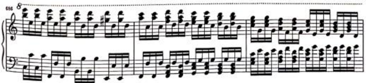
Görsel 40: Dördüncü Bölüm 677-688. Ölçüler (Verlag, 1974, s. 29)