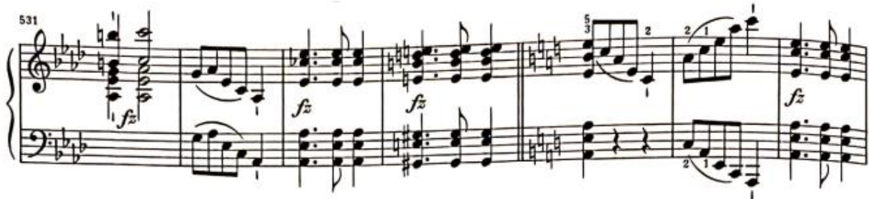
Görşel 31: Üçüncü Bölüm, 531-537. Ölçüler (Verlag, 1974, s. 24)

Kısa bir şekilde birinci tema anımsatıldıktan sonra 535. Ölçüde artık eseri dördüncü bölüme bağlayacak olan la minör tonundaki köprü başlamaktadır. Tonalite değişmeden hemen bir ölçü önce la minörün dominant yedili akoru duyurulup tona önden hazırlık yapılmaktadır.