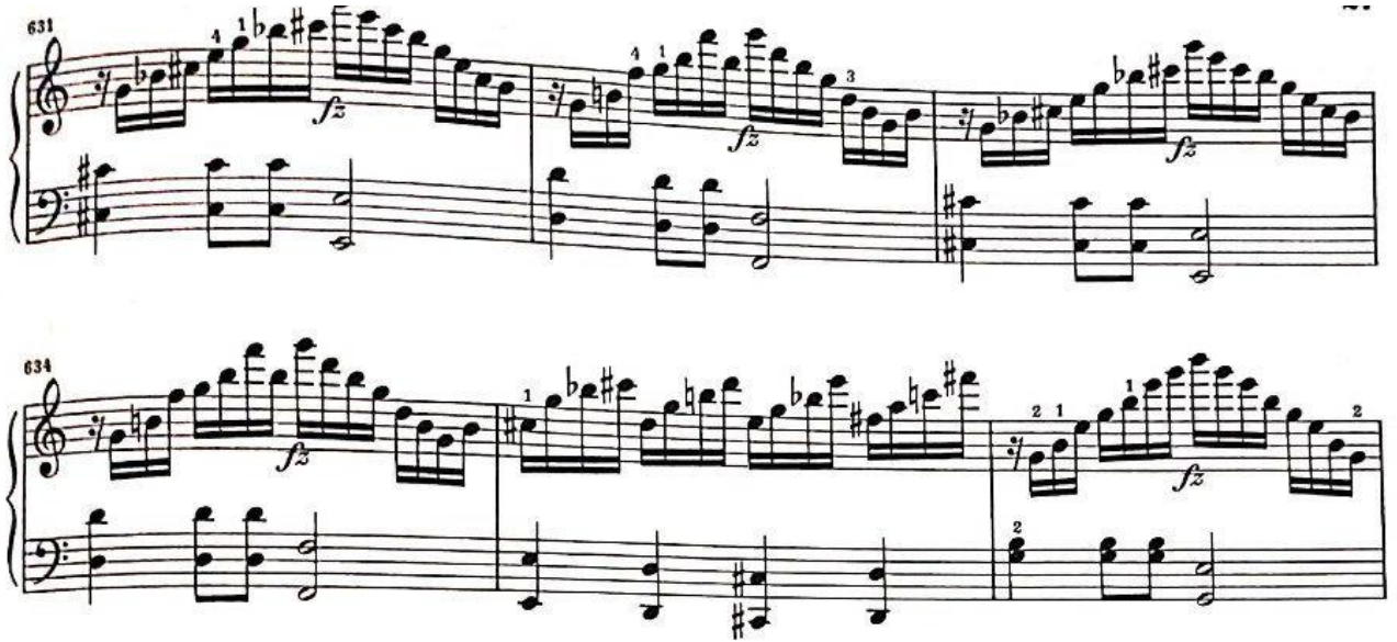
Görsel 35: Dördüncü Bölüm, 631-639. Ölçüler (Verlag, 1974, s. 27)

Bu görkemli açılış bölümünden sonra 631-648. Ölçüler arasında birinci episod (ara bölme) başlamaktadır. Bu bölmenin başında sağ eldeki inişli çıkışlı arpejlerin altında bütün eseri etkisi altına alan ritmik motif sol elde belirgin şekilde duyulmaktadır.