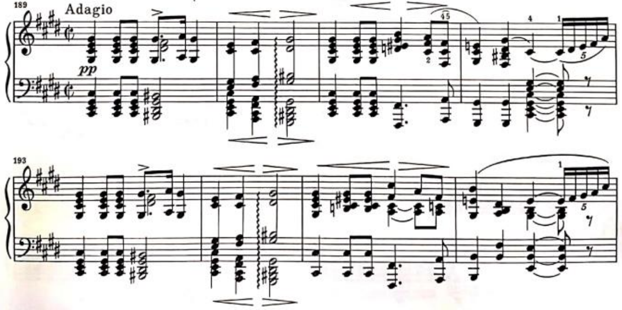
Görsel 14: İkinci Bölüm, 189-196. Ölçüler (Verlag, 1974, s. 9)

Temanın sunumundan hemen sonra 197. Ölçüde birinci varyasyon denilebilecek olan bölme ana tonun ilgili majör tonalitesi olan Mi Majör tonunda başlamaktadır. Tema üst sesler ile sunulurken sağ el ve sol elde hafif çalınması gereken onaltılıklar temaya eşlik etmektedir.