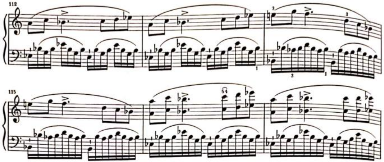
Görsel 9: Birinci Bölüm, 112-167. Ölçüler (Verlag, 1974, s. 6)

Ölçü 132’de Re bemol majör akorunun gelmesiyle, bu lirik ve dramatik atmosfer yerini kaosa bırakır ve bu yeni başlangıç, teknik açıdan oldukça zor olan tamamlayıcı köprünün kapılarını aralamaktadır. Sıkça kullanılan oktavlar ve geniş aralıklı akorları icracının kontrollü bir şekilde çalması önem taşımaktadır.