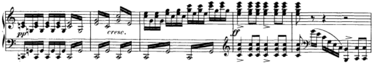
Görsel 6: 1.Bölüm, 67-71. Ölçüler (IMSLP, https://s9.imslp.org/files/imglnks/usimg/4/4e/IMSLP53591-PMLP86693-Schubert_Werke_Breitkopf_Serie_11_No_108_Op_15.pdf )

83. ölçüden itibaren giriş temasını anımsatan ritmik motif üzerine işlenmiş gamlar ile fırtınalı ve uzun bağlayıcı köprüye başlanmaktadır. Önce sol elde, sonra sağ elde gelen bu tema motifi bizi ikinci temaya taşımaktadır.