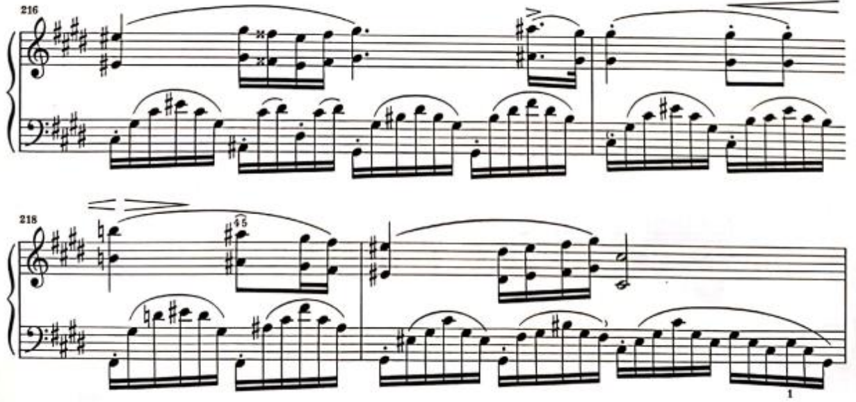
Görsel 18: İkinci Bölüm, 216-218. Ölçüler (Verlag, 1974, s. 11)

Bu iç ısıtan liriklikteki varyasyonun hemen ardından 219. Ölçüde do diyez minör tonalitesinde ‘üçüncü varyasyon’ gelmektedir. Bu varyasyon bir öncekine göre çok daha dramatik bir yapıdadır. Sol elde duyulan üçleme akorların üstünde tema sağ elde oktav olarak sunulmaktadır. Sağ elde gelen temanın yanı sıra sol elde armoni değişimleriyle beraber bir çizgi gözlemlenmektedir. Bu çizgide gelen ikili aralıklar dramatik havayı destekleyici olmaktadır.