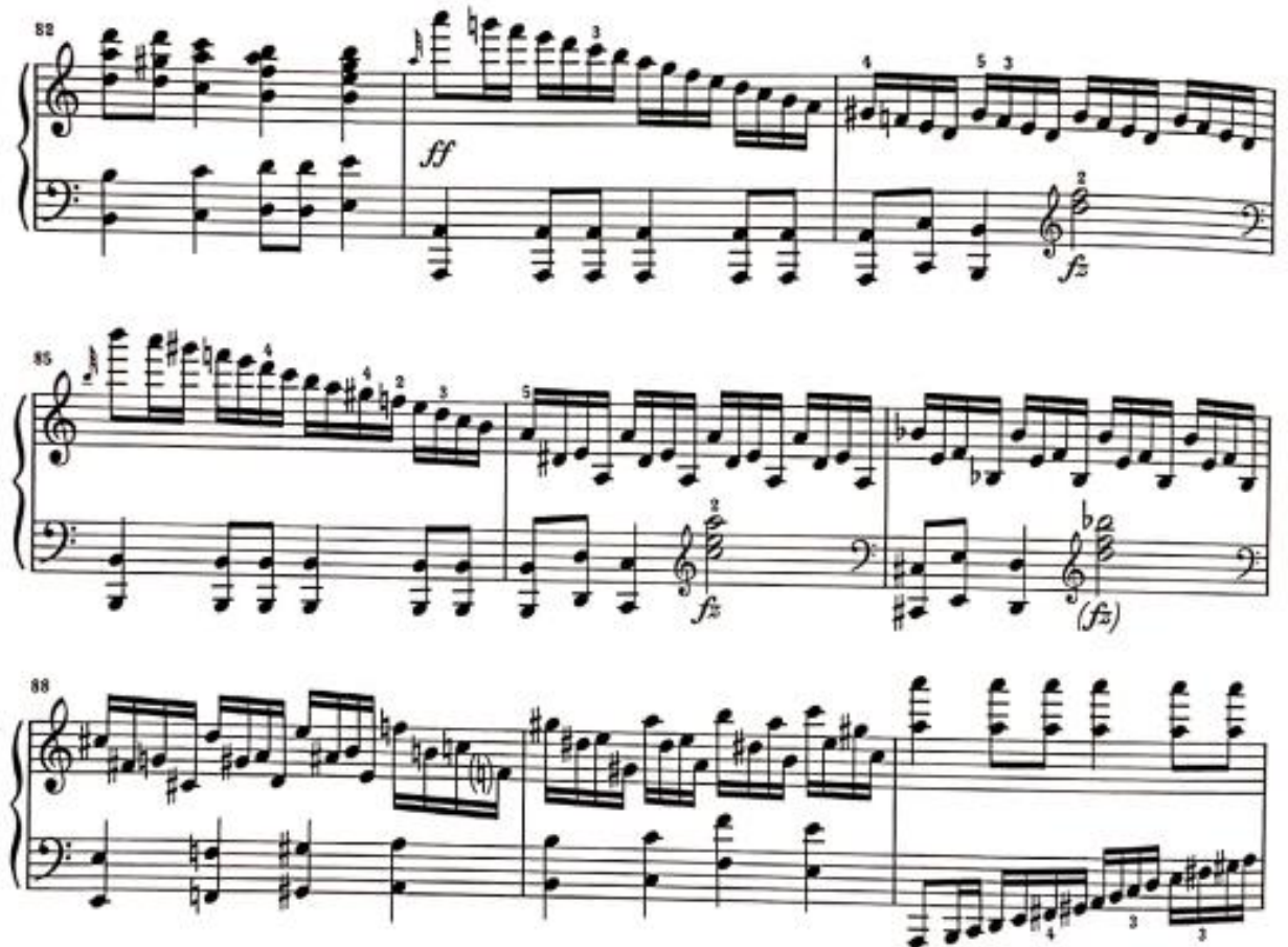
Görsel 7: Birinci Bölüm, 82-93. Ölçüler (Verlag, 1974, s. 4)

83. ölçüden itibaren giriş temasını anımsatan ritmik motif üzerine işlenmiş gamlar ile fırtınalı ve uzun bağlayıcı köprüye başlanmaktadır. Önce sol elde, sonra sağ elde gelen bu tema motifi bizi ikinci temaya taşımaktadır.