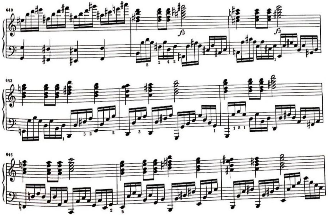
Görsel 36: Dördüncü Bölüm, 640-648. Ölçüler (Verlag, 1974, s. 27)

Ardından iki elin rolleri deęişerek, saę elde ritmik motif ve sol elde eşlik partisinin olduęu bir armonik yürüyüş başlamaktadır. Bu yürüyüş bizi 649. Ölçüdeki ikinci episoda taşımaktadır.