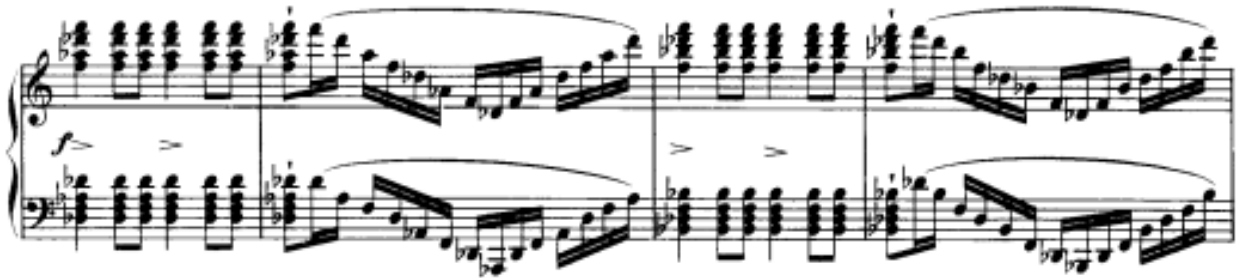
Görsel 10: Birinci Bölüm, 132-135. Ölçüler

Ölçü 132’de Re bemol majör akorunun gelmesiyle, bu lirik ve dramatik atmosfer yerini kaosa bırakır ve bu yeni başlangıç, teknik açıdan oldukça zor olan tamamlayıcı köprünün kapılarını aralamaktadır. Sıkça kullanılan oktavlar ve geniş aralıklı akorları icracının kontrollü bir şekilde çalması önem taşımaktadır.