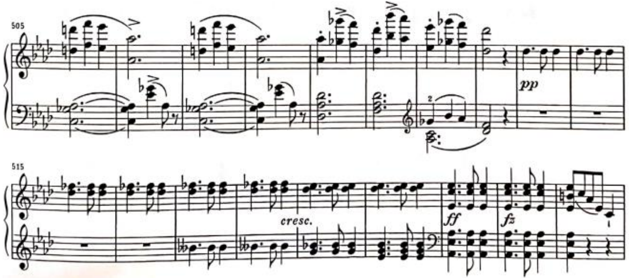
Görşel 30: Üçüncü Bölüm, 505-523. Ölçüler (Verlag, 1974, s. 23)

Kısa bir şekilde birinci tema anımsatıldıktan sonra 535. Ölçüde artık eseri dördüncü bölüme bağlayacak olan la minör tonundaki köprü başlamaktadır. Tonalite değişmeden hemen bir ölçü önce la minörün dominant yedili akoru duyurulup tona önden hazırlık yapılmaktadır.