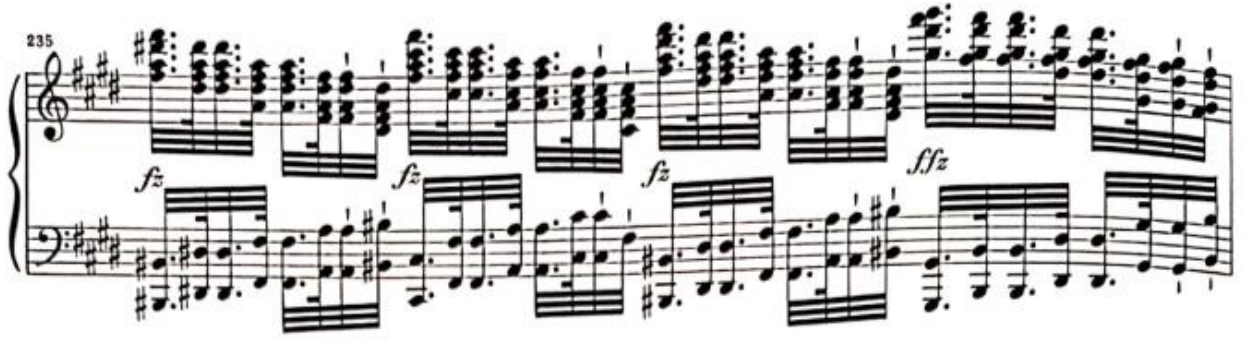
Görsel 22: İkinci bölüm, 235. Ölçü (Verlag, 1974, s. 16)

Bu köprü bölmesinin hemen ardından 236. Ölçüde artık bizi sona hazırlayacak olan altıncı ve son varyasyon gelmektedir. Sol elde dalgalanma hissiyatı yaratan altmışdörtlük notaların üstünde sakince oktav şekilde sunulan tema bu defa yine Do diyez Majör tonunda gelmektedir.