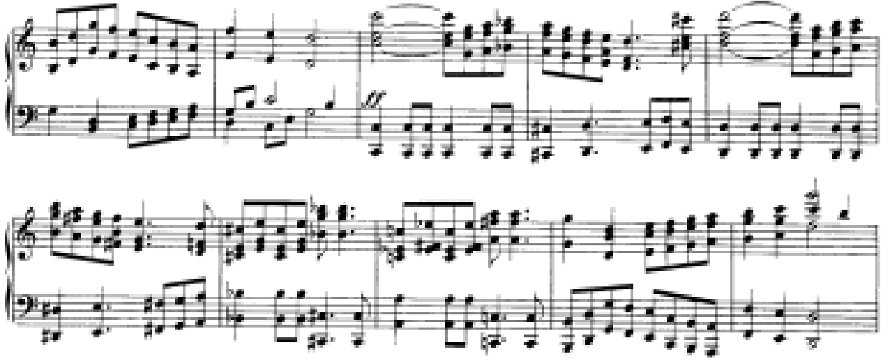
Görsel 34: Dördüncü Bölüm, 621-630. Ölçüler (Verlag, 1974, s. 26)

Bu görkemli açılış bölümünden sonra 631-648. Ölçüler arasında birinci episod (ara bölme) başlamaktadır. Bu bölmenin başında sağ eldeki inişli çıkışlı arpejlerin altında bütün eseri etkisi altına alan ritmik motif sol elde belirgin şekilde duyulmaktadır.