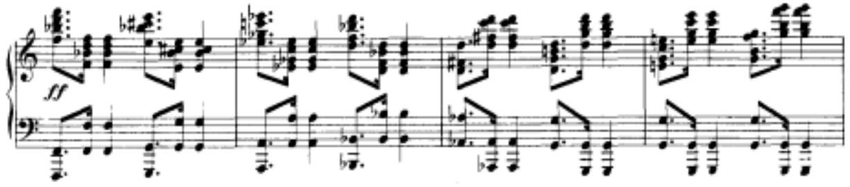
Görsel 39: Dördüncü Bölüm, 674-677. Ölçüler