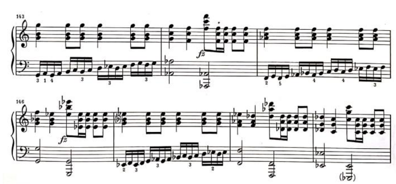
Görsel 11: Birinci Bölüm 143-149. Ölçüler (Verlag, 1974, s. 7)

Tamamlayıcı köprü 142. Ölçüde son bularak yerini 143. Ölçüde gelişme bölmesine bırakmaktadır. Gelişme bölmesi icracı için teknik açıdan zor ve yorucu bir bölme sayılabilmektedir. Melodilerin hep oktav veya dört sesli akorlar ile genelde ff şeklinde sunulması yorucu olmasının en önemli sebeplerindendir.