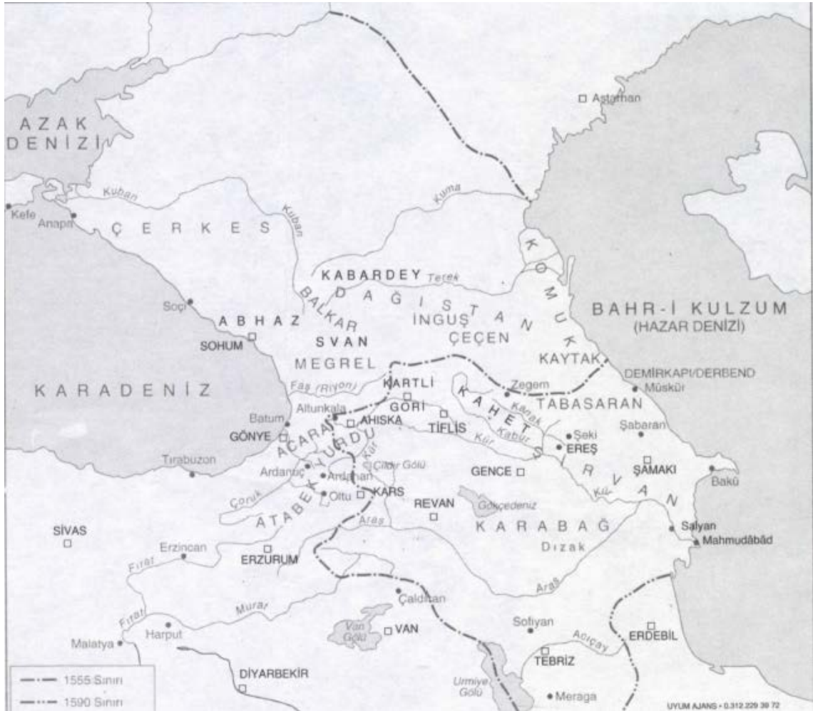
Harita 2: 1578-1590 Osmanlı-Safevi Savaşı Sırasında Kafkasya 229

İstanbul, Şirvan seferleri ve muhafazası sırasında Kafkasyalıların önemli bölümünü aktif olarak kullanmasa da kendi tarafında tutmak ve lojistik sorunlar yaşamamak amacıyla son derece hassas davrandı. Kafkasyalı beylerin herhangi bir görev için aldıkları fermanlar, çoğu kez hilatler ve hediyelerle birlikte geliyor, 230 iyi hizmete bulunanlar bağlılıkları ve katkılarından dolayı Padişahın övgüsüne mazhar oluyordu. 231 Bölgede İran ile mücadele devam ederken Osman Paşa'ya yüz adet hilat gönderilerek bunlardan yirmi bir tanesinin Çerkes ve Dağıstanlı beylere, kalanının da bölgedeki