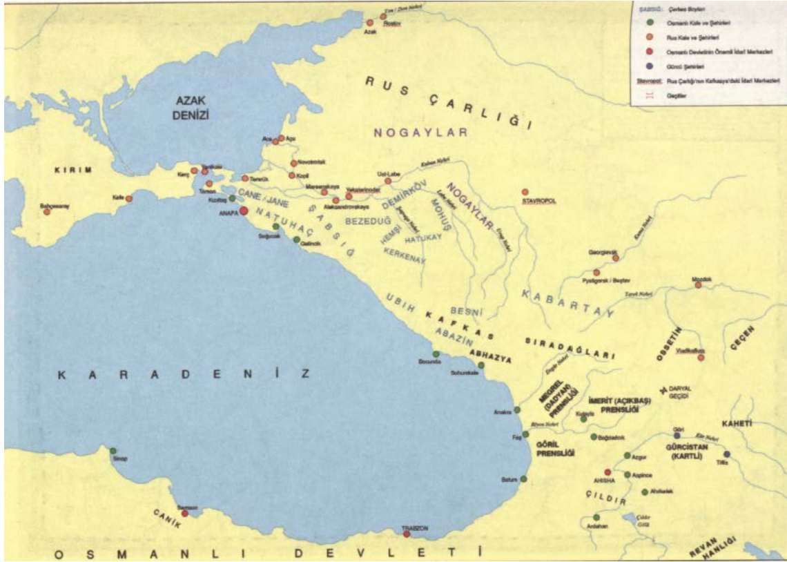
Harita 4: 18. Yüzyılın İkinci Yarısında Çerkes Kabileleri ile Diğer Kafkasya Halkları 373

Kale kurulması planlanan bölgede herhangi bir yerleşim yeri bulunmuyordu, yalnızca bütün Kabartayların kullandığı bilinen otlaklar vardı. Nitekim 1744'te, Ruslar burada çok daha mütevazî bir girişim olarak bir karakol inşa ettikleri zaman Büyük Kabartay prensleri ortak bir tepki vererek derhal yıktırılmasını sağlamışlardı. 374 Bu defa Rus dışişleri yetkilileri buranın Rusya sınırları içinde olduğunu ve Kurgoko'nun durumunun Belgrad Antlaşmasının Kabartay'ın bağımsızlığını tanıyan 6. Maddesi ile çelişmediğini savundu. Bunun için de taraflar arasındaki kaçakların iadesini öngören 8. Maddeyi yorumladılar. Kabartay bağımsız ve Kurgoko Rus topraklarında Hristiyan olduğuna göre herhangi bir ihlal söz konusu olmamalıydı. Bu değerlendirmenin barışı sürdürmek adına güçlü bir savunma olmadığı açıktı. Ancak öngörülen kazanımların cazibesi ve Osmanlı Devletinden gelecek tehdidi göğüsleyebilecek pozisyonda olmanın güveniyle