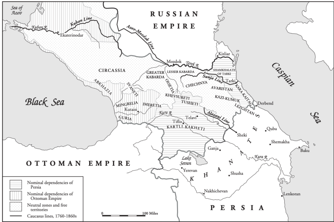
Harita 5: 1780'lerde Kafkasya 404

Diğer taraftan Osmanlı Devleti, Karadeniz sahilindeki Anapa ve Soğucak'ta bir üs kurarak bu bölgedeki Çerkeslerin desteğini kazanmak için harekete geçti. Bu iş için seçilen Ferah Ali Paşa öncelikle kapsamlı bir planlama yaparak görevin gerektirdiği bütün ihtiyaçları tespit etti. Cephane, mühimmat, gıda ve yapı malzemesi gibi ihtiyaçlardan marangoz, duvarcı ve demirci gibi her türlü teknik personele; maaşlardan Çerkes ileri gelenlerinin kalplerini kazanmak için kullanılacak olan hediyelerin cinsine kadar ayrıntılı bir değerlendirme yapan Ferah Ali Paşa, beklenen sonuçların alınabilmesi için taleplerinin harfiyen karşılanmasını istedi. 405