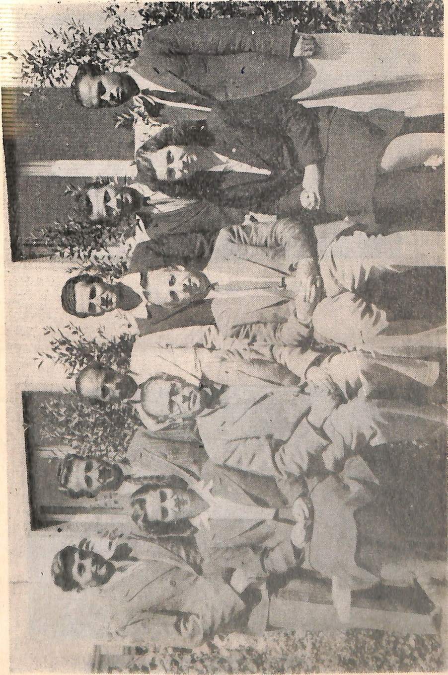
Zuckmayer ve Dostlari. 1943