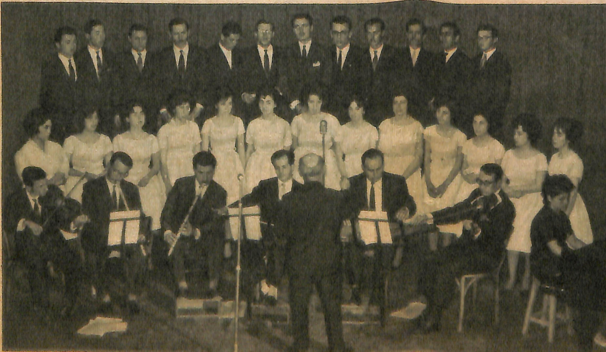
KORO — Yandaki resimde Üsküdar Musiki Cemiyeti korusu bir konser sırasında görülüyor.

09.00-09.20 İstanbulun Sesi 12.10-12.30 Afletap Karacan 13.00-13.20 Muzaffer Birtan 18.30-19.00 Radyo Kadınlar Faslı 19.40-20.00 Sadı Hoşses 21.30-22.00 Klâsik Koro