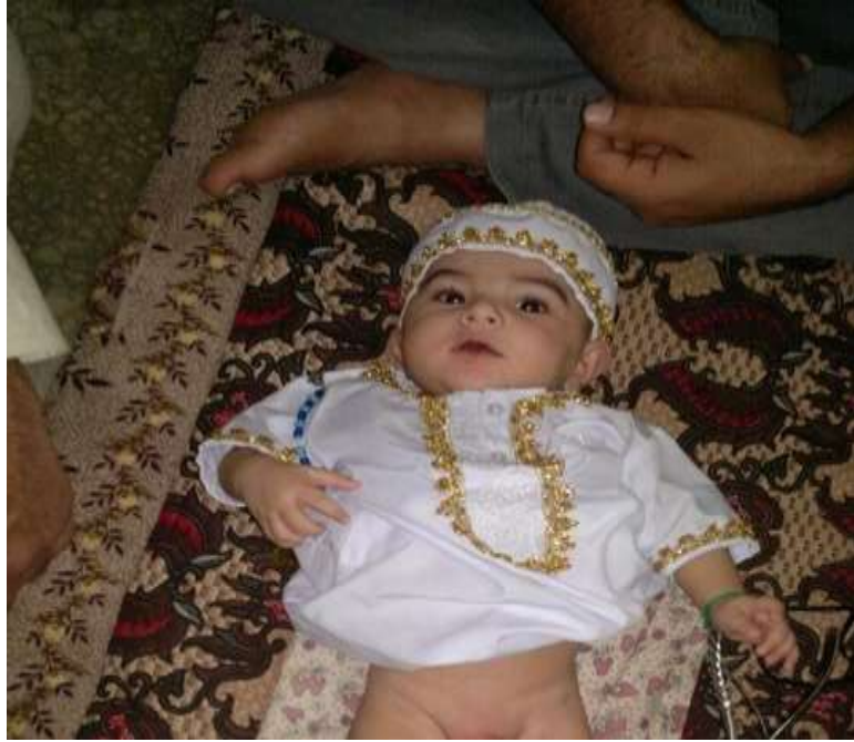
2. Fotoğraf : sünnet edilecek çocuk (Şeyhler 2013).

Günümüzde ise sünnet ve eğlence bir gün içerisinde yapılmaktadır. Yere peştamal serilir. Peştamal üzerine çocuğun babası ve yakınları tarafından para konulur. Toplanan bu para sünnet ustasına verilir. Ama günümüzde de bazı Türkmen yörelerinde hâlâ gelenekleri devam ettirmektedirler.