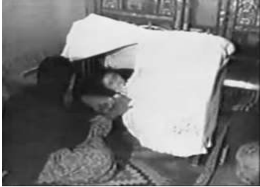
3. Beşikte Uyuması İçin Sallanılan Çocuk (Ağalar 2013).