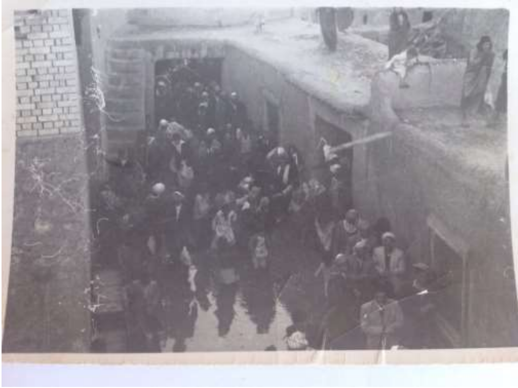
5. 1961 yılında kahaoğullarının düğününde çekilen bir fotoğraf (Kahaoğlu 2013).