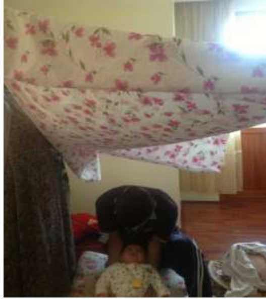
1. Çocuğun sünnet edildiği anda çekilen bir fotoğraf (Eroğlu 2013).

Sünnet çocuğunun giysisi ağır kumaştan deşten ve gömlek adlı özel kıyafetler dikilirdi. Çocuğun boynuna altın takılır, kafasına ise fes giydirilir. Çocuğa kıyafet alınırken bölgedeki diğer yetim ve fakir çocuklara da kıyafet alınırđı. Sünnet yapılırken akraba ve dostlar hazır bulunurlar. Sünnet için gerekli malzemeler bir tepsiye konulur. Sünnetçi gelip çocuğu sünnet eder. Sünnet anında salâvat çekilir. Çevredekiler alkışlar. Sünnetçinin parasını ise çocuğun babasıyla birlikte davetli olan kişiler karşılar. Davetliler yemek yedikten sonra çocuğa para ve armağan bırakırlar. Bir sonraki gün ise kadınlar gelirdi. Helhele, zılgıt çekip armağanlarını bırakırlar (Şahbaz 2013).