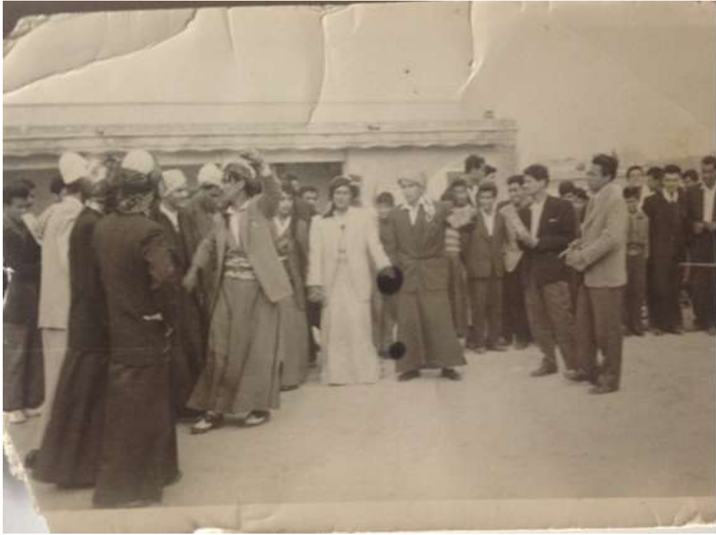
4. 1960 yılında ağalar'ın düğününde çekilen bir fotoğraf (Ağalar 2013).

Gelin damat evine galdikten sonra törene katılan tüm Erkekler evi hanımlara bırakıp yakındaki cami ve ya hemen hemen her köyde bulunan ve kutsal kabul edilen ziyaret yerlerine giderler. Bu ziyarette yapılan toplu dua'lardan sonra beyler damatla tokalaşıp öpüşerek tebrik ederler.